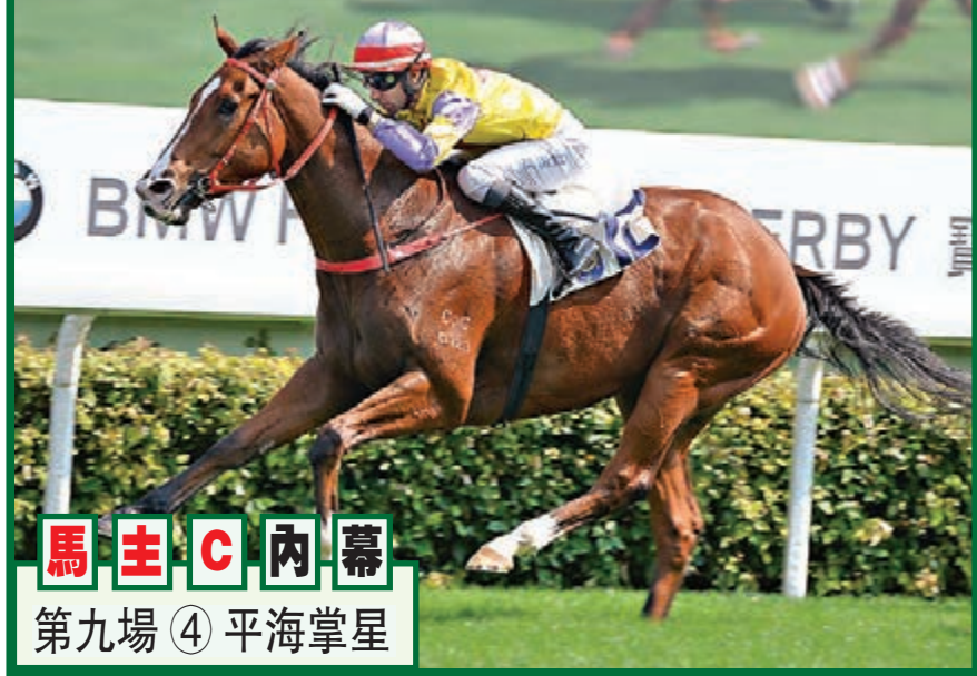
馬主C內幕 第九場 ④ 平海掌星

千四，全程留守在二三位，轉入直路薛恩及早踩油突圍，可惜最後被「至尊高陸」所擒，既然後駒再出再贏，今仗「嘉應精彩」續爭千四補中厚望。 第五場、第一班、二〇〇〇米。 「喜蓮彩星」來港前曾勝一級賽巴黎大賽，故首季來港已是頂尖賽常客，但此駒苦戰三季多只錄得三W，最強賽績乃於二班谷草千八殺低「天池怪俠」，今次田草二千也合腳法，若交出應有水準，有權邁向第四捷。 第六場、第四班、一六〇〇米。 「天天精彩」元旦日角逐一哩成大冷門，於彭國年跨下在最後直路如飛殺上得季軍，技驚四座；看上仗再爭此程，潘頓選擇留後角逐，惟入彎時仍按兵不動，最終姍姍來遲只跑第三；今回再戰決心贏番場。 第七場、國際二級賽、一二〇〇米。 「忠心勇士」今季三歲身形更魁梧，國慶日復出一役，出關後被擠撞而嚴重失去平衡下跑第三，打後再跑三仗取得兩冠一季，尤其喉香港短途錦標只輸頭位跑第三末竟全功，今次養精蓄銳再打硬仗，誠屬正路首選。