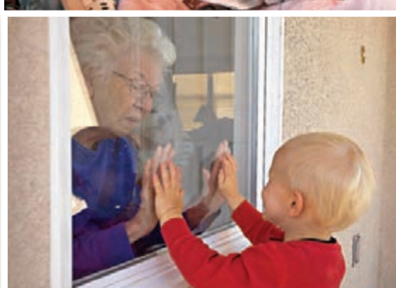
■ 加州護老院一名老人生日但未能外出，有附近居民特地前來慶生。