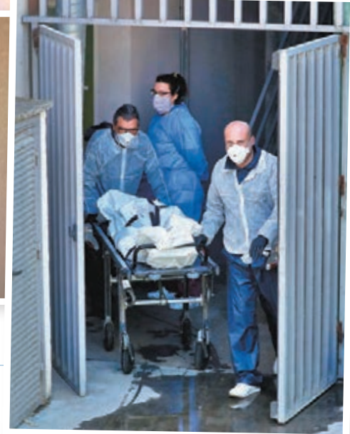
■ 西班牙人員從護老院接走一具遺體。