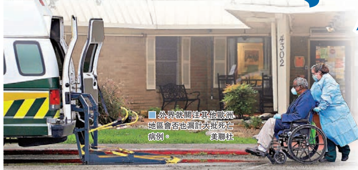
■ 外界就關注其他歐洲地區是否也漏計大批死亡病例。

運輸部長努涅斯警告，任何人假如違反居家令多於3次，便不止會面臨罰款，而是會被視作犯罪。法國上月17日實施居家令後，執法人員至今已截查580萬人，並作出35.9萬次罰款。 ■綜合報道