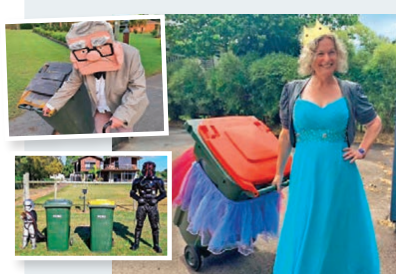
■ 網民在社交網載盛裝扔垃圾的照片。

新冠肺炎疫情下，全球多地限制出行。在澳洲，有網民號召民眾把握在每周清理垃圾的機會，打扮自己自娛娛人，結果獲得熱烈反應。發起活動的網民上載自己打扮成迪士尼電影《冰雪奇緣》女主角艾莎的照片，並在社交網表示雖然有點難為情，但她還是「挺過去」，還和別人揮手，「這些帶點瘋狂的小舉動，如果是在平常的日子，就未必這樣好笑了」。 ■綜合報道