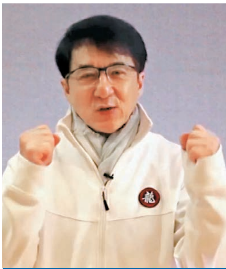
成龍為中國加油！為世界加油！

成龍昨日凌晨於社交平台發文，叫中國加油及世界加油，並上載中、英語兩段短片作出呼籲及為大家打氣：「大家好，我是成龍！我知道現在對每個人來說，都是非常困難的時刻，我們都面臨着同樣的問題——新型冠狀病毒肺炎，遵守政府的指示是非常重要的，和家人留在家門避免不必要的出門，如果一定要出外或者工作，記緊一定要戴上口罩、常常洗手，保護好自己就是保護你的家人。大家要注意安全，一定要堅強，我堅信明天一定會更好！中國加油！世界加油！加油！」而演藝界眾人亦盡一點心意，發文悼念逝者及向抗疫英雄致敬。