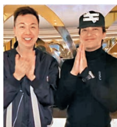
陳曉東(右)為前線醫護鼓掌。