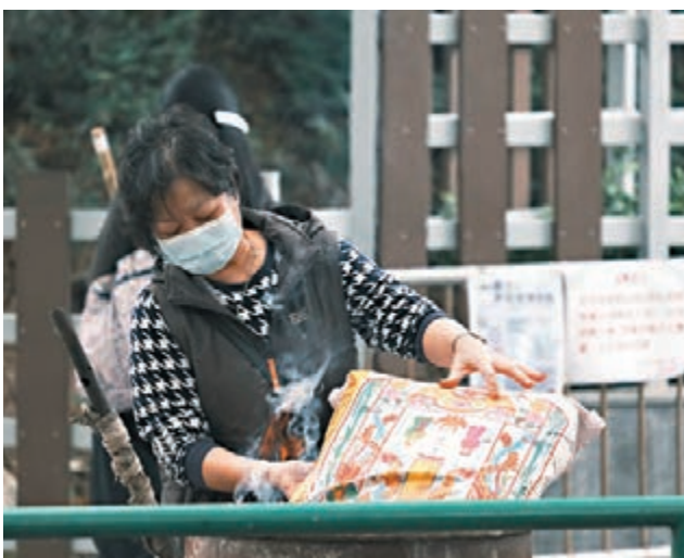
■市民提早拜祭祖先，準備鮮花、紙紮祭品和香燭。