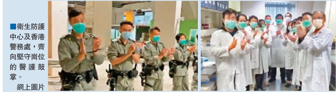
■衛生防護中心及香港警務處，齊向堅守崗位的醫護致敬。