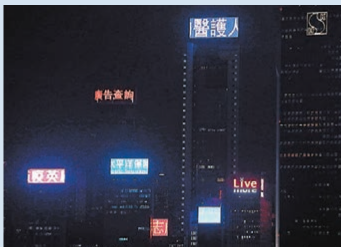
■向堅守崗位的醫護人員致敬。

昨晚8時，香港社區基金亦發起「為香港鼓掌」(Clap for Hong Kong)活動，市民齊拍掌為醫護打氣，衛生防護中心及香港警務處等亦上載短片，齊齊向堅守崗位的醫護鼓掌。