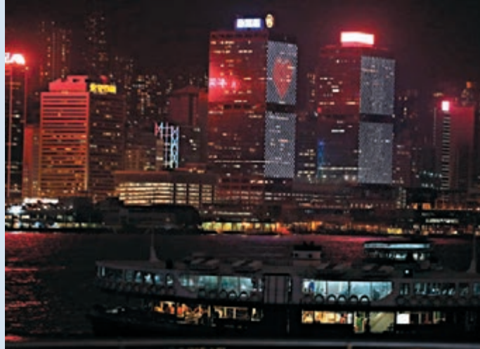
■大廈外牆燈飾標語展示活動。