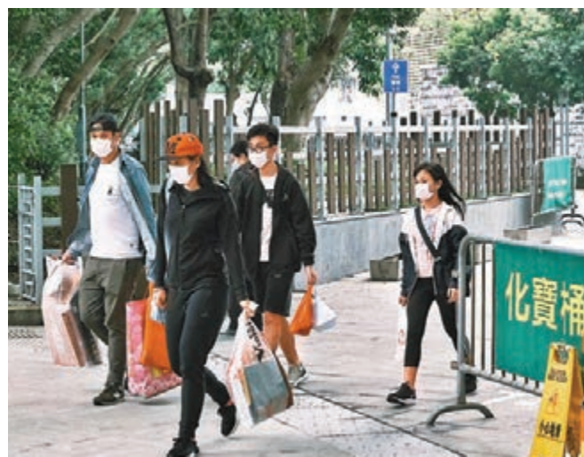
■鑽石山墳場，清明祭祖掃墓要守規例。