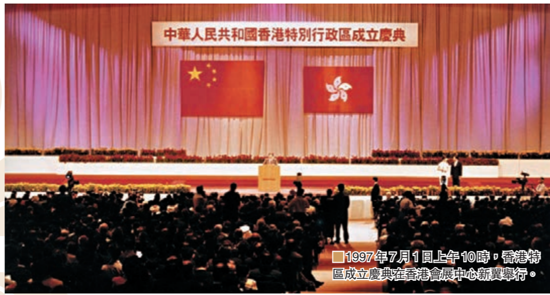
1997年7月1日上午10時，香港特別行政區成立典禮在香港會展中心新翼舉行。

1996年5月15日 全國人大常委會通過了關於中國國籍法在港實施的幾個問題解釋。 1996年6月25日 籌委會法律小組討論基本法第二十四條有關香港永久性居民規定的實施問題。 1996年7月5日 籌委會臨時立法會小組討論香港特別行政區臨時立法會的產生辦法。