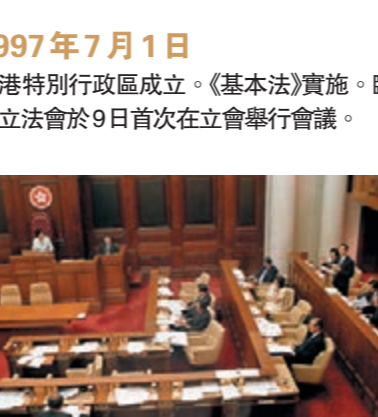
1997年7月1日，香港特別行政區成立。《基本法》實施。臨時立法會於9日首次在立會舉行會議。

1997年5月22日 籌委會通過了《中華人民共和國香港特別行政區第一屆立法會的具體產生辦法》、《全國人民代表大會香港特別行政區籌備委員會關於對〈中華人民共和國香港特別行政區基本法〉附件三所列全國性法律作出增減的建議》和《全國人民代表大會香港特別行政區籌備委員會關於香港特別行政區有關人員就職宣誓事宜的決定》。 1997年6月27日 全國人大常委會成立香港基本法委員會，作為常委會下設的工作委員會。