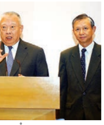
2003年9月5日，特區撤回《國家安全(立法條文)條例草案》。