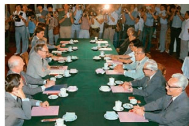
鄧小平會見英國首相戴卓爾夫人。

1983年3月8日 市政局第一次分區選舉。 1983年7月25日 中國政府代表團與英國政府代表團在北京就中英香港問題第二階段會談舉行第二次會議。