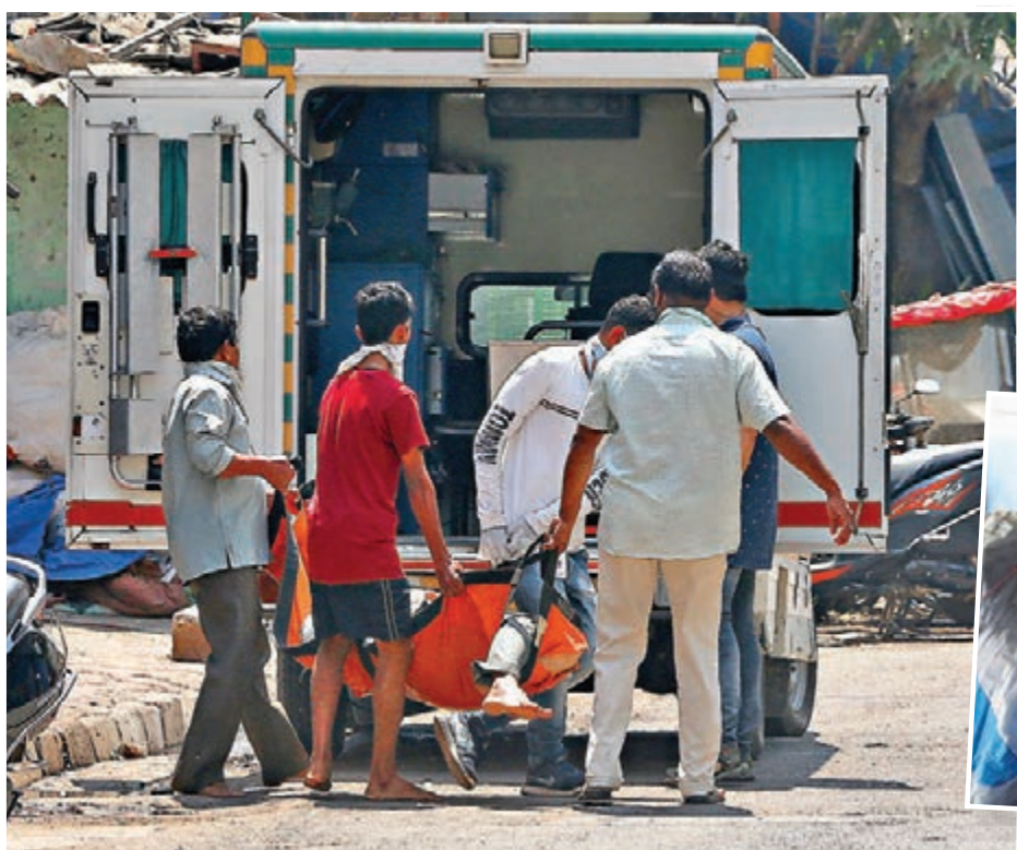
印度新增多宗確診病例。圖為孟買病人被抬上救護車送院。

根據政府頒佈的宵禁政策，超市和商店從4月2日開始，每天從早上9時營業到下午5時，周日不營業。民眾嚴格按照姓氏首字母順序，每家一次最多一人出門購物，離家者必須持有身份證、戴口罩和手套進入超市，而且在超市內不得停留超過30分鐘。超市和商店的入口設置檢核點，控制人流和人數，購物及結賬時必須保持安全的距離。