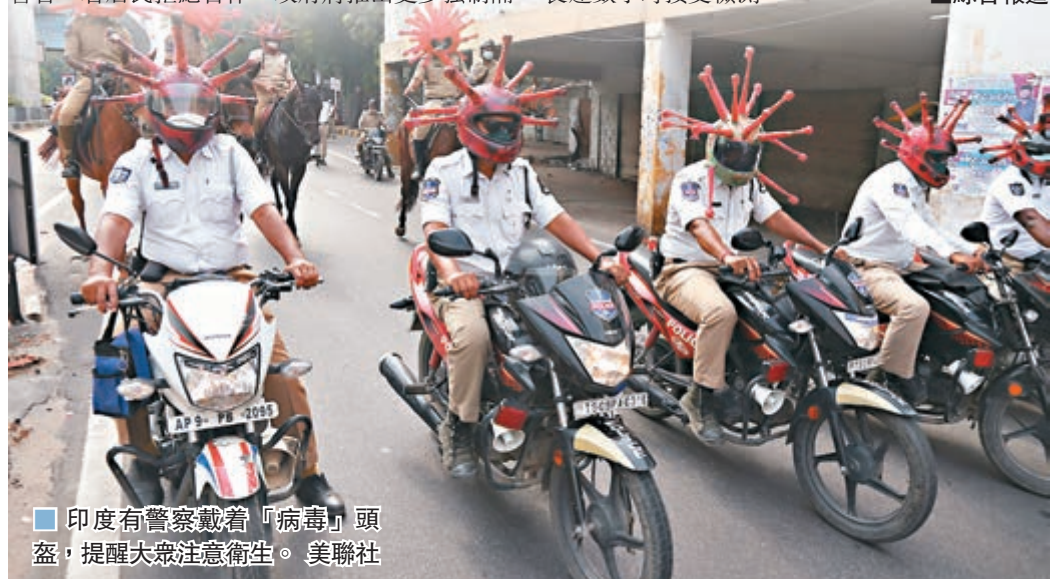
印度有警察戴着「病毒」頭盔，提醒大眾注意衛生。