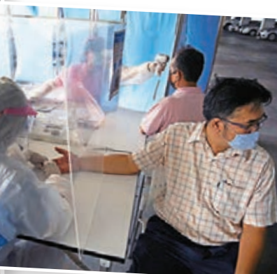
泰國連續6日有多人確診。圖為曼谷民眾接受檢測。