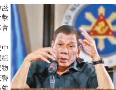
杜特爾特促請人們遵守隔離令。

杜特爾特被指試圖運用他在掃毒戰中的鐵腕手段，應對疫情危機，有人權組織表示，杜特爾特應提供急需的醫療物資，而非威脅使用武力。菲律賓國家警察總長則表示，杜特爾特的言論只為強調法治的重要性，警方是不會射殺任何違反隔離措施的人。