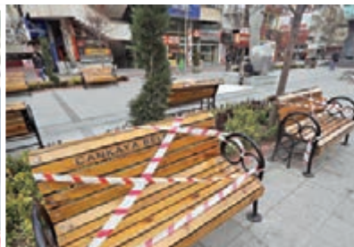
土耳其病例大幅飆升，有路邊長椅被圍封。