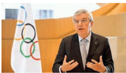
國際奧委會主席巴赫無奈宣佈東京奧運會延期。

目前香港的奧運電視版權，仍未知花落誰家。而現在東京奧運延期1年，那香港各個電視台就可以有多些時間來重新計劃，考慮如何去爭取播映權了。