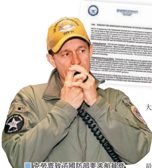
克勞齊致函國防部要求船員登岸隔離。

美國核動力航空母艦「羅斯福」號已有至少100多人確診新冠肺炎，艦長克勞齊致函國防部，要求軍方安排逾4,000名船員登岸進行隔離，以免重蹈郵輪「鑽石公主」號的覆轍。不過防長埃斯珀表示，船上沒有確診患者屬重症，拒絕現時安排船員撤離艦隻。