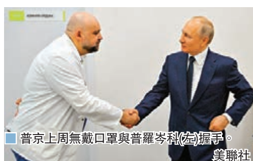
普京上週無戴口罩與普羅岑科(左)握手。

任職俄羅斯一間接收新冠肺炎患者的醫院的普羅岑科醫生前日確診，由於普羅岑科上週二曾陪同總統普京視察該院，探訪新冠肺炎病人，兩人握手談話時均沒有使用口罩或其他防護裝備，惹來普京可能中招的憂慮。克里姆林宮則表示，普京有定期接受新冠病毒檢測，其健康狀況良好。