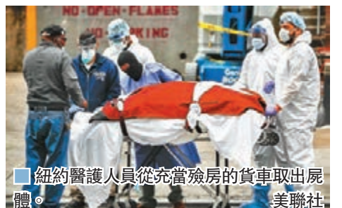
紐約醫護人員從充當殮房的貨車取出屍體。