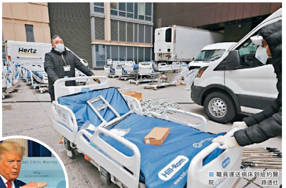
職員運送病床到紐約醫院。