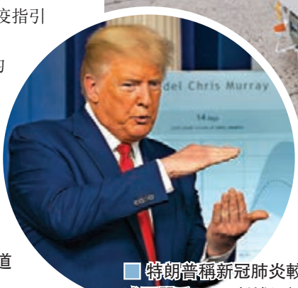
特朗普稱新冠肺炎較流感更嚴重。