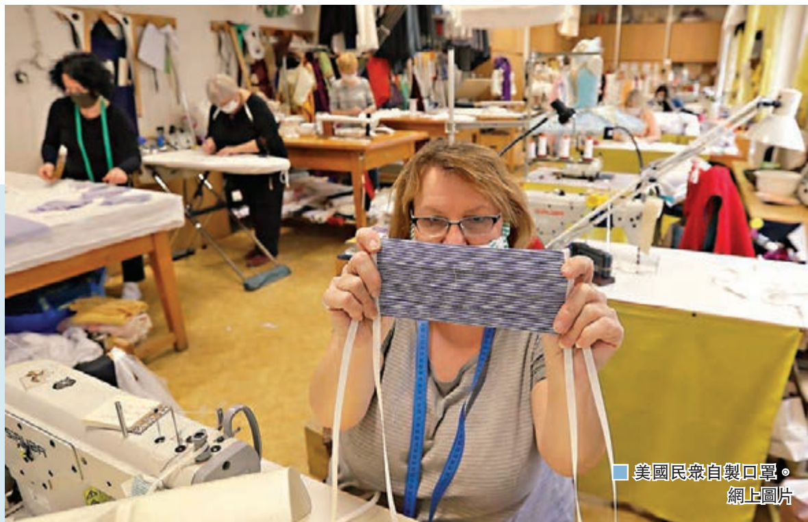
美國民眾自製口罩。

全球新冠肺炎疫情至今仍未見頂，新增確診及死亡個案天天創新高，昨日全球總確診個案已升穿80萬大關。嚴峻的現實令歐美多國政府及醫療專家不得不改變長期以來的立場，包括一般民眾是否需要戴口罩的問題。美國疾病控制及預防中心(CDC)據報正研究修改官方指引，鼓勵美國人在公眾地方，以自製口罩遮蓋面部，但暫時仍不建議使用外科口罩或N95口罩。總統特朗普前日亦證實當局有類似想法。