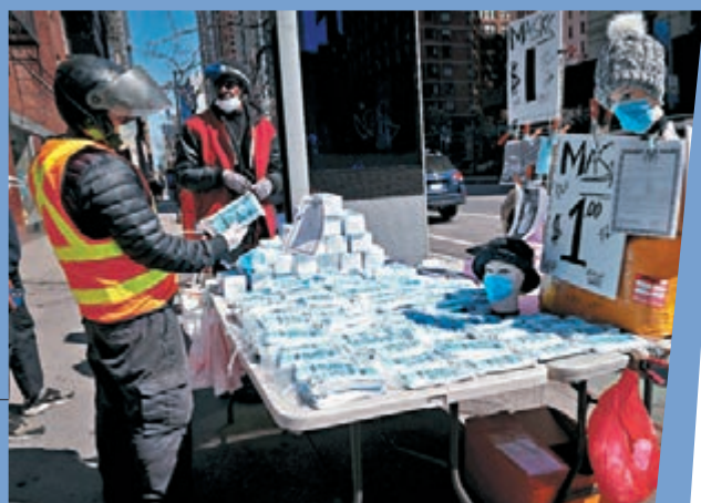
紐約街頭有小販售賣口罩。