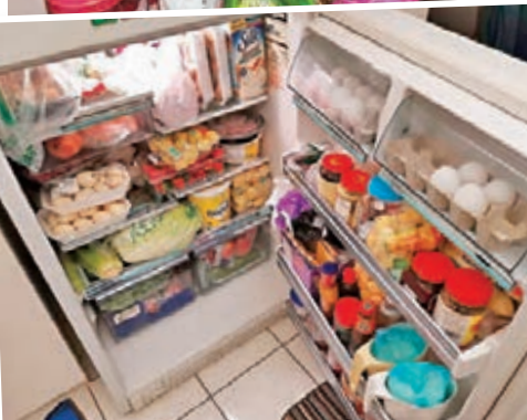
加拿大華人家庭購買大批糧食。

香港文匯報訊 (特約記者成小智 多倫多報導) 新冠肺炎疫情在北美洲繼續惡化，繼美國部署軍方協助救災後，加拿大總理杜魯多亦宣佈2.4萬名正規和後備軍已經準備就緒，被派駐全國各地隨時協助要求支援的各省和地方政府，軍隊協助範圍從執行家居隔離令、供應日常必需品至提供人道支援。加國全國新冠肺炎確診宗數突破7,700，總參謀長溫斯誓言軍隊早已「操勞」保持最佳狀態，竭盡全力保衛國民克服這場新冠肺炎危機。