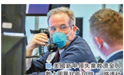
美國新申領失業救濟金人數上周暴升逾10倍。

美國新申領失業救濟金人數上周暴升逾10倍，創下328萬的最高紀錄，預料本周新申領人數仍會達200多萬。市場調查機構Challenger, Gray & Christmas發現，美國49%企業承認