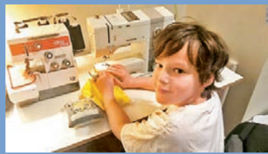
兒童亦有響應自製口罩活動。