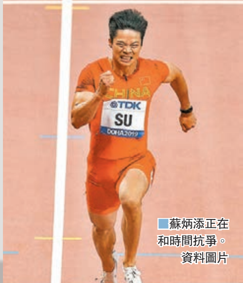
蘇炳添正在和時間抗爭。資料圖片