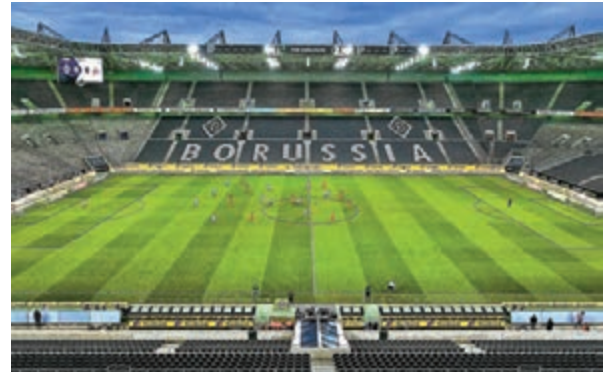
慕遜加柏準備在看台放人偶。

歐洲多家球會受停賽影響而收入大減，最新要作節流措施的有紐卡素，會方昨日宣佈要求職員暫放無薪假，球員不受影響，「喜鵲」亦成為新冠疫情下首家要求職工放無薪假的英超球會。