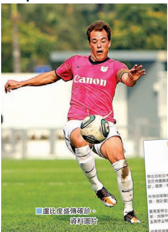
盧比度盛傳確診。資料圖片