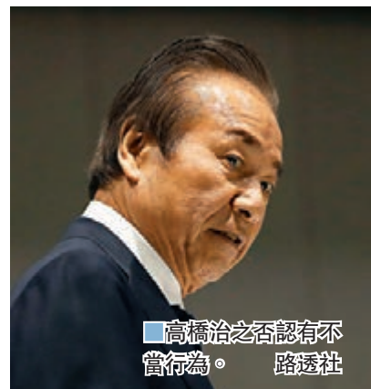
高橋治之否認有不當行為。

法國調查人員又懷疑，東京申奧委員會有否曾經透過一名新加坡顧問，交付230萬美元來贏得戴亞克的支持。