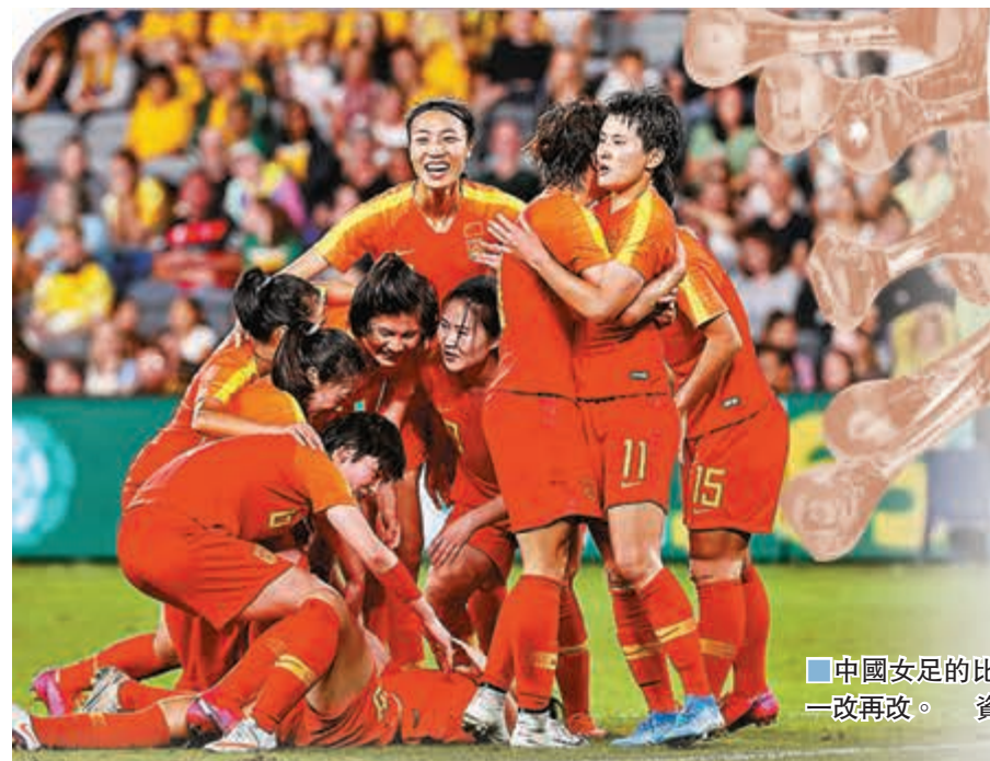
中國女足的比賽日期一改再改。資料圖片

因疫情推遲一年的東京奧運會定於2021年7月23日至8月8日舉行，但這一改變絕非是改變奧運聖火在日本國立競技場點燃的時刻那般簡單。除各單項資格賽及各單項世錦賽須作出更改協調外，對運動員也造成不同程度的影響。