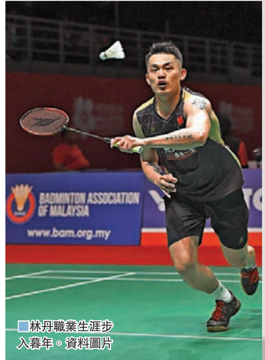
林丹職業生涯步入暮年。資料圖片