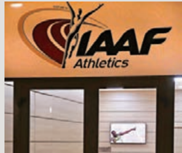
IAAF正與俄勒岡田徑世錦賽組織者商討延期安排。

香港文匯報訊(記者 陳曉莉)東京奧運會確定明年7月23日至8月8日舉行，包括世界田聯、國際泳聯、國際乒聯及世界羽聯在內的多個世界體育組織先後表態，將延期各項世錦賽，為東奧讓路。