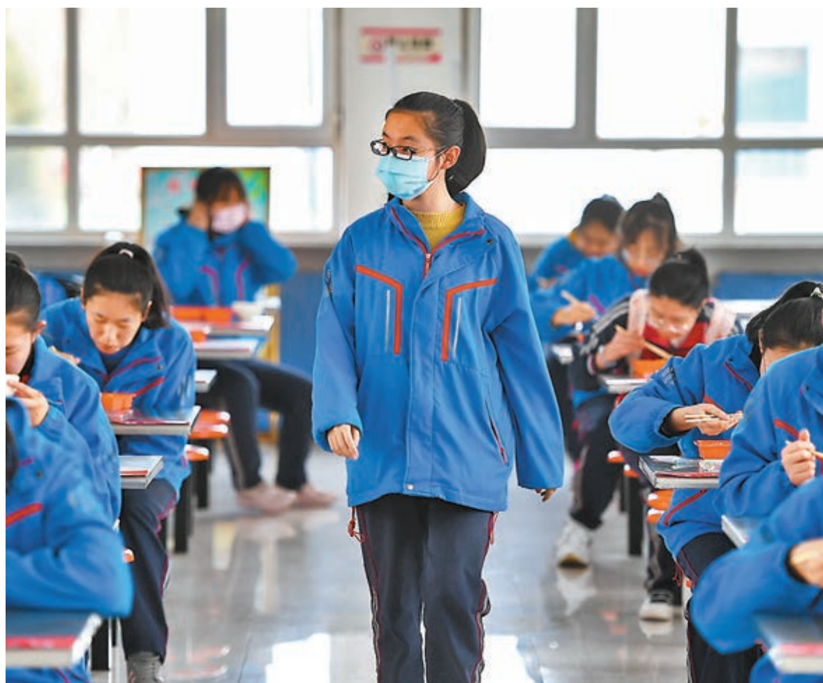
教育部表示，延期主要基於「安全第一」、「公平第一」兩點考慮。圖為內蒙古高三初三已復課，呼和浩特市鐵一高中高三學生用餐後準備離開。