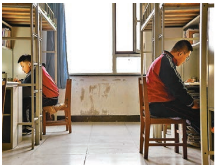
大部分家長對備考時間增加表示歡迎。圖為呼和浩特市鐵一高中高三學生利用午休時間在宿舍隔間位置學習。

教育部公佈了最新高考時間和各科考試的具體安排，並指出湖北省、北京市兩地可根據疫情防情況，研究提出本地區高考時間安排的意見，教育部同意後及時向社會發佈。從2003年內地將高考時間調整到6月7日、8日起，只發生過一次高考時間的局部調整，即2008年汶川大地震時，震區學生的高考推遲近一個月。全國範圍內將高考時間推遲一個月，尚是第一次。