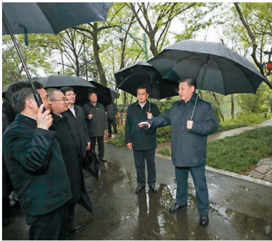
■習近平昨日考察杭州濕地保護利用和城市治理情況。

這樣的工作模式，目的正如該中心的簡介牌上所說：積極推動「最多跑一次」改革理念在社會治理領域實踐運用，全力打造回應群眾訴求、化解矛盾糾紛的終點站。