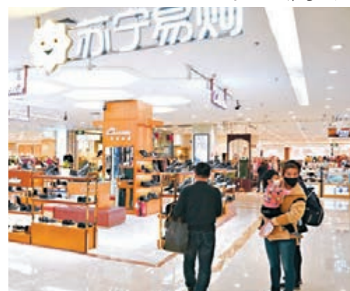
■稅務部門將確保把中央減稅降費的「真金白銀」送到百姓的手中。圖為哈爾濱市民在商場購物。

阿扎高度讚賞中方為抗擊疫情付出的努力和取得的巨大成績，感謝中方就疫情防控與美方保持密切溝通，表示中方有關防疫經驗和創新舉措對美方當前疫情應對具有借鑒意義，美方願與中方進一步加強交流，中美衛生健康合作將開啟新篇章。