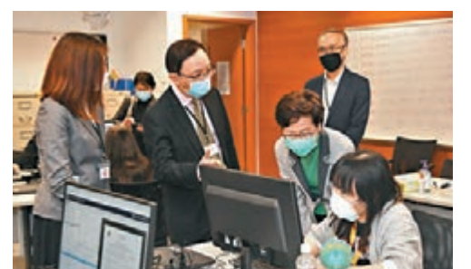
林鄭月娥到訪資料辦，為工作人員打氣。

香港文匯報訊（記者 鄭治祖）自海外抵港者須強制進行檢疫的措施在3月19日生效至今，衛生署已向5萬人發出檢疫令，政府各部門需動員數以千計人員和義工執行檢疫工作，包括監察檢疫者及為他們提供各項支援。行政長官林鄭月娥昨日出席活動時表示，鑑於接受強制檢疫者人數眾多，檢疫者的自律和配合對措施的成效至為重要，但政府亦會以零容忍的態度對違反檢疫令的個案採取嚴厲的執法行動。她呼籲檢疫者為己為人，不要以身試法。