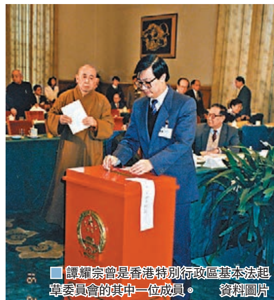
譚耀宗曾是香港特別行政區基本法起草委員會的其中一位成員。資料圖片

譚耀宗憶述，基本法在1990年4月4日正式頒佈。此前，起草委員會委員們在起草過程中已意識到，像政制等問題會在社會引起爭論，事實上有關議題至今仍在社會有熱烈討論。不過，委員會認為過早決定所有事情未必適合，因此最後選擇用一系列機制、時間表及路線圖來解決，將問題延後討論及作具體的決定。