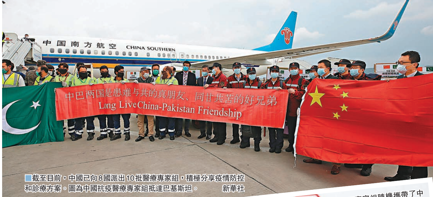
■截至目前，中國已向8國派出10批醫療專家組，積極分享疫情防控和診療方案。圖為中國防疫專家組抵達巴基斯坦。