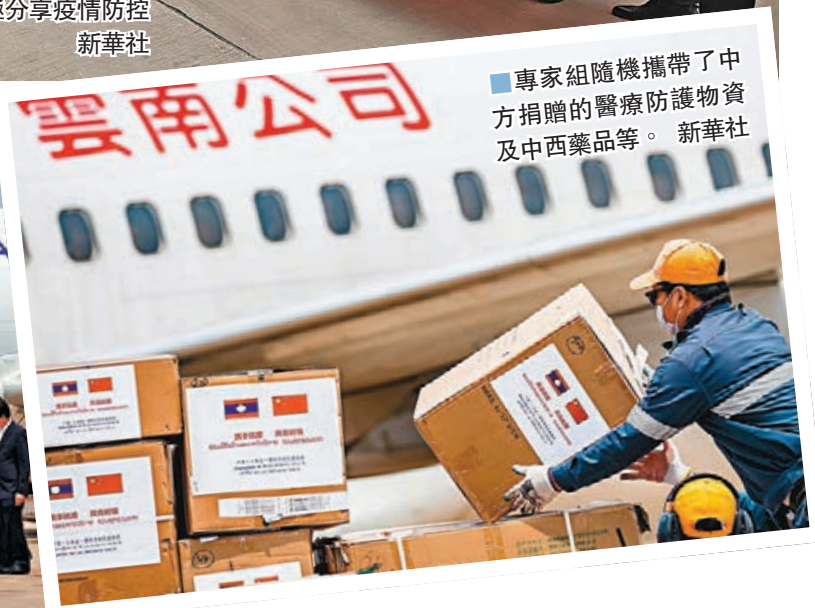
■專家組隨機攜帶了中方捐贈的醫療防護物資及中西藥品等。