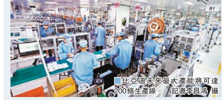
比亞迪未來最大產能將可達200條生產線。

香港文匯報訊（記者 李昌鴻）作為全球口罩最大生產商，比亞迪目前每日產量已突破500萬片，並正持續擴充生產線。比亞迪股份總裁辦公室主任李巍告訴香港文匯報記者，未來生產線最高達200條，日產將達1,000萬片。