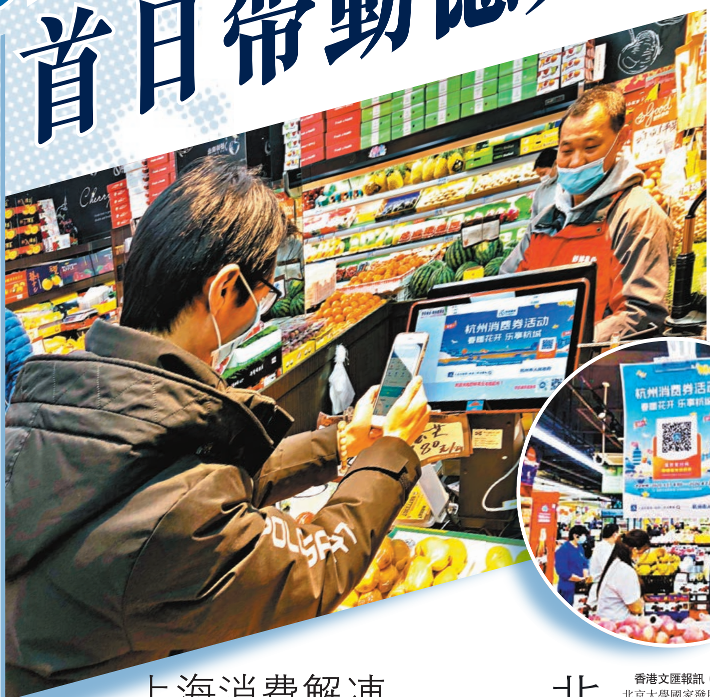
▲杭州派16.8億元消費券帶動門市銷售。圖為市民在掃二維碼領取消費券。香港文匯報記者王莉攝

派發消費券這一舉措在短期內大幅促進了杭州旅遊、商業等行業的消費增長,使杭州市的社會消費品零售總額增速在當年3月見底後,迅速反彈,且遠超全國速度。