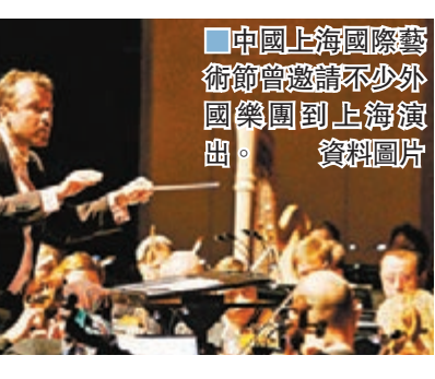
中國上海國際藝術節曾邀請不少外國樂團到上海演出。資料圖片

萄牙、瑞士、塞爾維亞及立陶宛等國的演藝機構完成線上「雲簽約」並不容易。這些簽約項目涉及三大洲，橫跨十多個時區，並且各國都受到疫情影響。