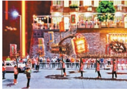
大坑舞火龍 主辦方供圖