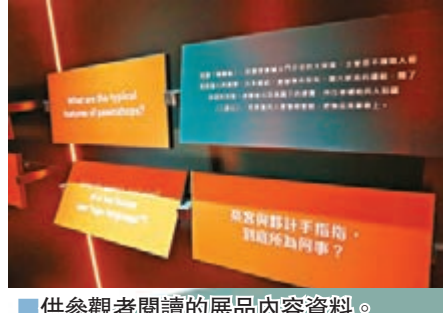
供參觀者閱讀的展品內容資料。