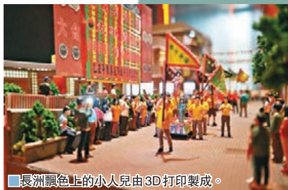
長洲飄色上的小人兒由3D打印製成。