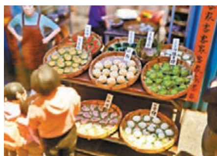
客家茶樓店的茶糕造型精緻。