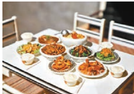
飯饊模型十分精巧