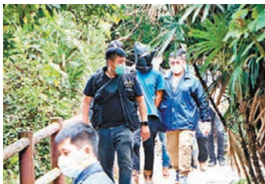
■一名主犯昨日被押返石屋兵工廠搜查。