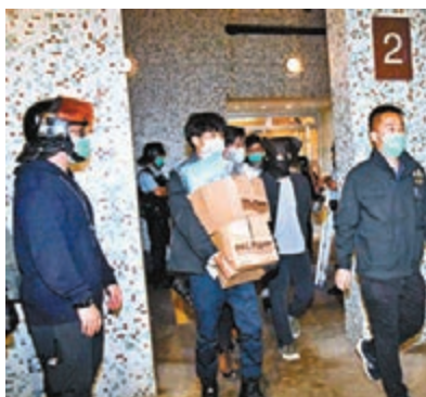
■警方在小西灣富怡花園拘捕一名男子。