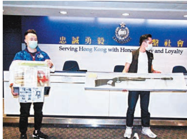
小西灣石屋兵工廠內佈滿各種工具和原材料。