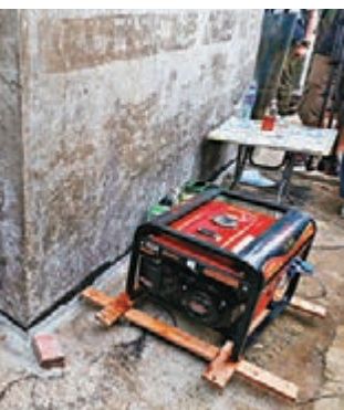
■石屋兵工廠自備發電機。