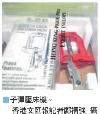
■子彈壓床機。