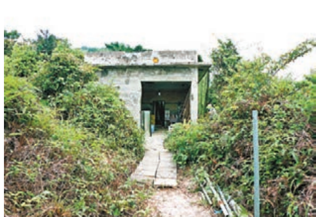
小西灣龍躍徑石屋兵工廠外觀。