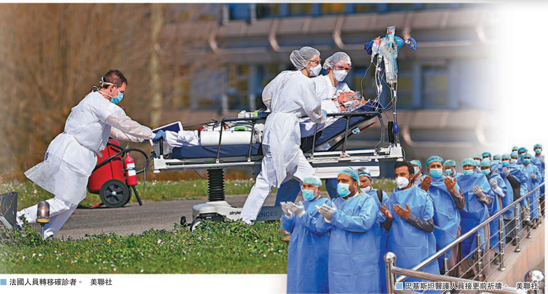
■法國人員轉移確診者。

特朗普同時表示期望經濟活動盡快重啟，正動用一切經濟、科學、醫學和軍事資源，向新冠病毒「發動戰爭」，並繼續呼籲民眾留在家中保持社交距離。 ■綜合報道