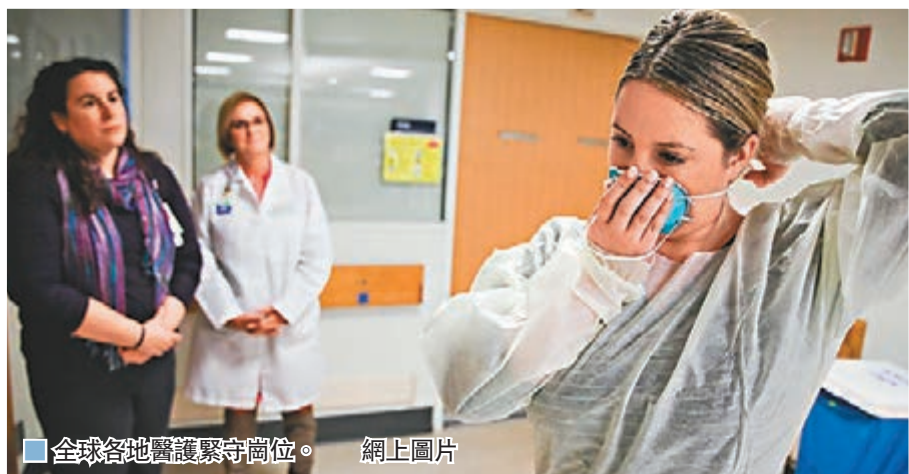
■全球各地醫護緊守崗位。 網上圖片

G20領導人前日在特別峰會後發表聯合聲明，同意向全球經濟注入超過5萬億美元(約39萬億元)，應對疫情及其影響；增加疫苗及藥物研發基金，加強全球科研合作；承諾加強世衛協調職責，並盡快向「新冠病毒戰略防範與應對方案」注資。 ■綜合報道