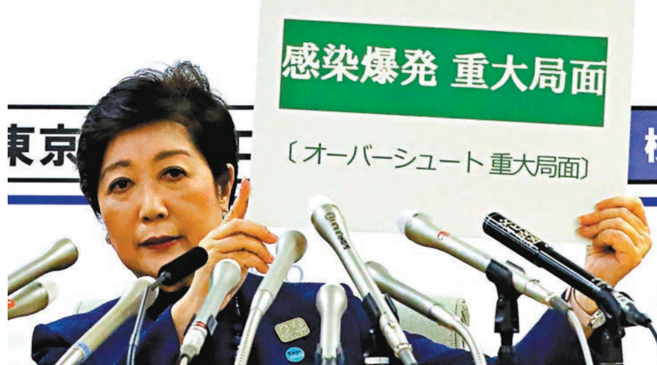
小池警告，東京疫情或出現爆發式增長。