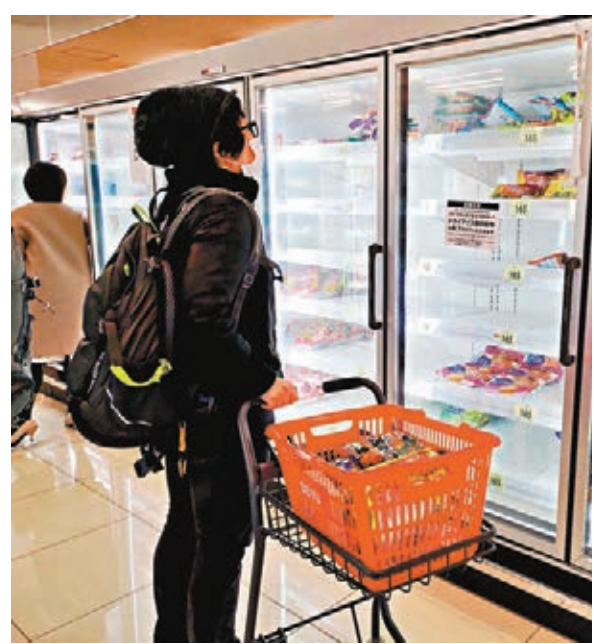
東京民眾在超市搶購商品。