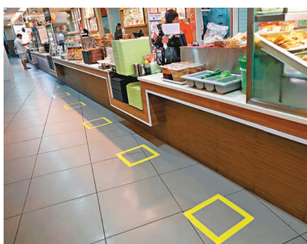
新加坡商店在地板上以膠貼劃區，鼓勵消費者保持社交距離。

另一方面，馬來西亞總理慕尤丁昨日宣佈，所有內閣成員一律減薪兩個月，並將減薪金額捐給新冠肺炎救濟基金，希望透過此舉為所有前線醫護人員打氣。大馬防長依斯邁沙比利則指出，由於許多人遵守行動管制