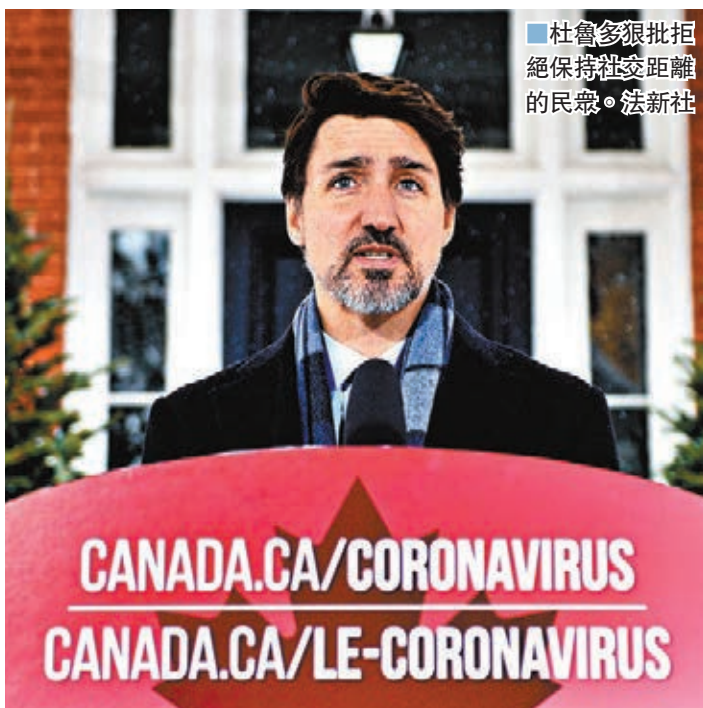
杜魯多狠批拒絕保持社交距離的民眾。