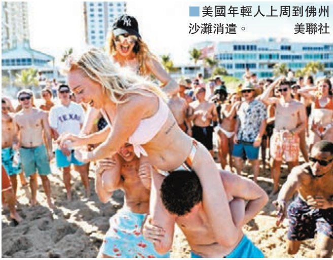
美國年輕人上週到佛州沙灘消遣。