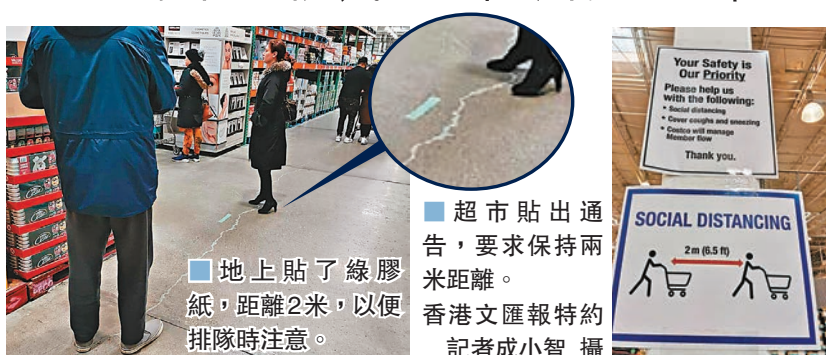
超市貼出通告，要求保持兩米距離。

加拿大多地在疫情下，相繼收緊行動管制，居於溫哥華的香港移民Emily表示，當地市面遠比平常冷清，少數外出的人士也嚴守社交距離，「現在只有超市有人氣」。Emily表示，溫哥華市政府下令所有餐廳、酒樓和快餐店禁止堂食，只可外賣，但大部分餐廳已乾脆暫停營