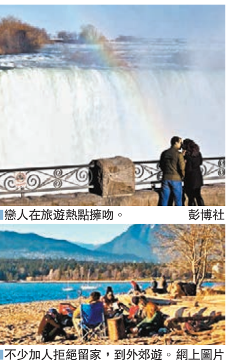
戀人在旅遊熱點擁吻。