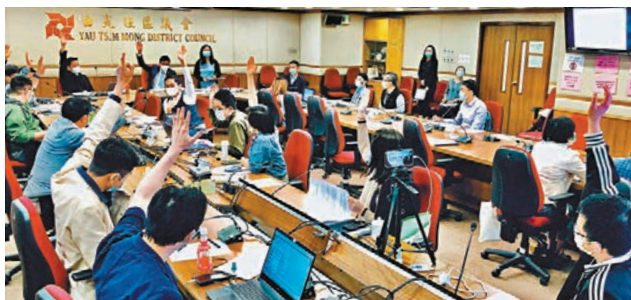
▲油尖旺區議會通過動議，要求拆除旺角西洋菜南街天眼系統。

為阻嚇2008年至2009年發生的3次高空投擲雜物水彈暴行，油尖旺區議會轄下地區設施管理委員會在2009年撥款約164萬元設置「天眼」系統。上屆油尖旺區議會在去年決議撥款150萬元更新系統，並把系統適用範圍的有關指引，從防止高空擲物，擴展至協助所有刑事案件的調查。過去大半年黑暴肆虐，旺角街頭曾發生多宗暴徒動私刑、圍毆欺凌行人的罪案，有關系統或有助警方調查。