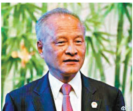
■駐美大使崔天凱。

崔天凱日前接受AXIOS和HBO聯合節目的採訪，就新冠肺炎疫情、中美關係等回答記者提問。他說，中美合作是唯一正確選擇。唯有雙方共同努力，推進以協調、合作、穩定為基調的中美關係，兩國人民才能擁有美好未來。我們堅決反對企圖挑起兩國對抗、發動「新冷戰」、鼓噪所謂經濟脫鉤的做法，這不符合且將嚴重傷害兩國人民的真正利益。