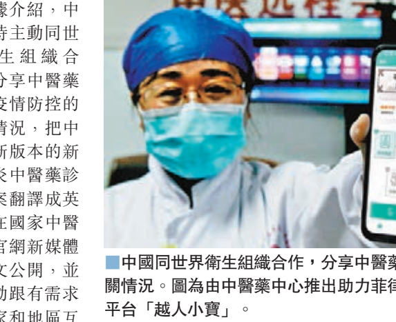
■中國同世界衛生組織合作，分享中醫藥參與疫情防務的有關情況。圖為中醫藥中心推出助力菲律賓防控新冠肺炎的平台「越人小寶」。

供力所能及的援助。據介紹，中國及時主動同世界衛生組織合作，分享中醫藥參與疫情防務的有關情況，把中國最新版本的新冠肺炎中醫藥診療方案翻譯成英文，在國家中醫藥局官網新媒體上全文公開，並且主動跟有需求的國家和地區互相分享。