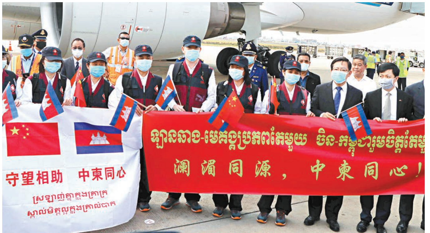
■崔天凱指出，中方願意，也正努力同其他國家開展抗疫合作。圖為中國醫療組抵達金邊助東埔寨抗擊疫情。

對於所謂中國在早期隱瞞疫情的說法，崔天凱認為這是「歪曲事實」。他指出，這不是一個掩蓋真相的過程，而是一個發現這種新型病毒的過程，要確認病毒種類，更多了解它，更多了解它的傳播途徑以及如何應對。實際上，僅僅在幾周之內，中國就向世界衛生組織通報了了解到的所有情況，包括病毒的基因序列。中國向世衛組織和其他國家發出提醒，大約兩三周內，武漢市就採取了封城措施。