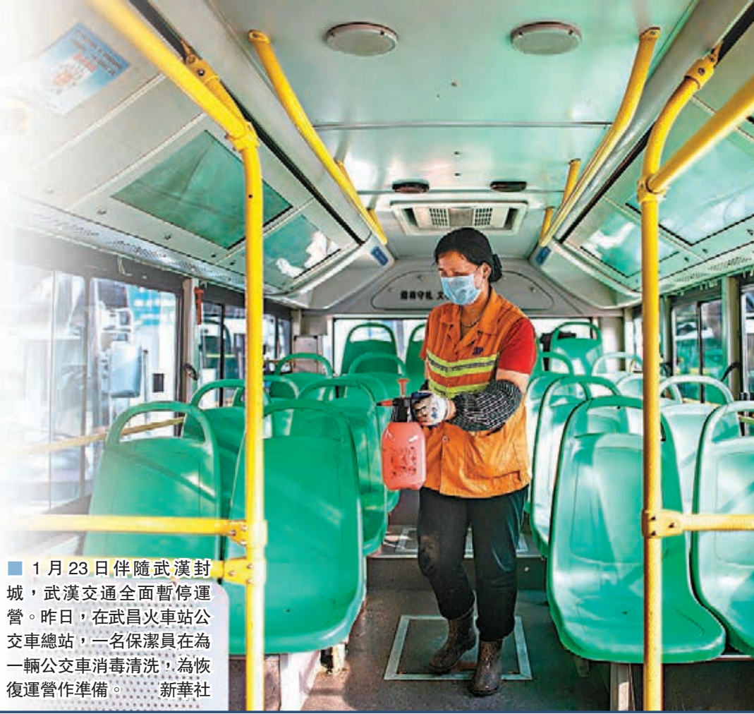
1月23日伴隨武漢封城，武漢交通全面暫停運營。昨日，在武昌火車站公共交通總站，一名保潔員在為一輛公共車消毒清洗，為恢復運營作準備。

香港文匯報訊 武漢連續多日報告的新增確診及疑似病例為零，中央應對新冠肺炎疫情工作領導小組昨日指出，以武漢市為主戰場的全國本土疫情傳播已基本阻斷，但零星散發病例和局部爆發疫情的風險仍然存在。武漢疫情分析小組近日接受中新社記者專訪時指出，仍可能有無症狀感染者等潛在的傳染源存在。武漢市如果再出現零星病例亦屬正常。疫情分析小組組長、中國疾病預防控制中心研究生院副院長、教育培訓處處長羅會明指出，零報告不等於零病例，零病例亦不等於零風險。社會對疫情「歸零」的迫切期盼可以理解，但有時一味地強調「零病例、零死亡」並不利於科學防控。