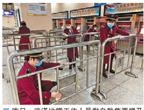
昨日，武漢地鐵工作人員對自動售票機及隔離欄等進行清潔消毒。

過去近60天，武漢曾連續17天新增報告的確診病例數超過千人、峰值達13,000多例。3月11日，武漢新增報告的確診病例首度降至個位數。國家衛健委疾控局副局長雷正龍表示，新增報告的確診數字明顯下降是公眾期待成果，說明前段工作有成效。此外，出院人數不斷增多、重症及危重症病人數減少、每日新增死亡人數降低等均佐證形勢向好的判斷。「但必須承認，仍可能有無症狀感染者等潛在的傳染源存在。所以，我們今後對於疫情走勢要有容忍度，特別是當社區出現零星病例報告時。」他進一步指出，武漢市如果再出現零