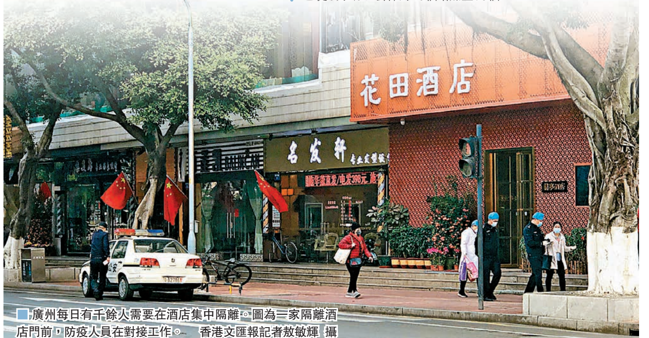
廣州每日有千餘人需要在酒店集中隔離。圖為一家隔離酒店門前，防疫人員在對接工作。

這些旅客中，除居家隔離外，每日有千餘人需要在酒店集中隔離。為此，廣州市不斷優化調整全市隔離場所，全市的隔離酒店已從3月20日公佈的40個增加至76個。