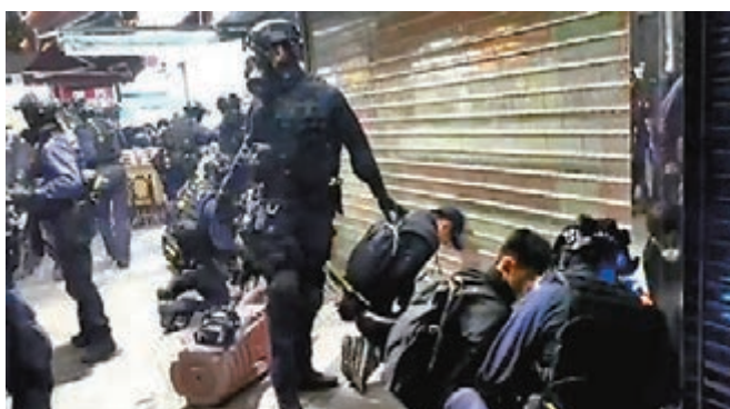
防暴警搜查多名黑衣人。

香港文匯報訊(記者 蕭景源)本港疫情再度升溫之際，泛暴議員卻藉去年元朗西鐵站發生的「7·21」事件，大搞所謂的事發8個月「紀念日」，煽惑暴徒前晚開始通宵在元朗西鐵站和大棠路一帶通宵堵路縱火和投擲汽油彈，破壞社會安寧，至昨日凌晨警方一共拘捕61人，當中包括民主黨元朗區議會主席黃偉賢和屯門區議會友愛南區議員林健翔。另外，立法會議員許智峯(「鴿峯」)亦一度到場「嗆咪抽水」，惟被警察公共關係科警司高振邦發現沒戴口罩，質疑其「播毒」行為，要求「戴返口罩先喇！」面對質疑，許智峯即時變得面憎憎，啞口無言。