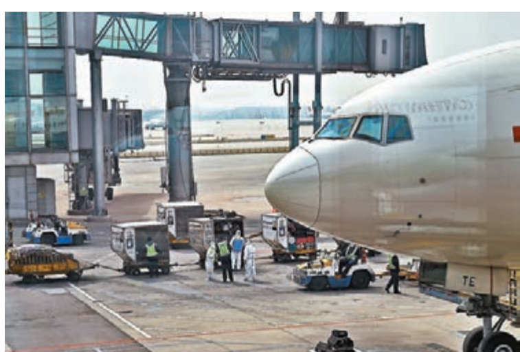
今日起,目的地為北京的國際航班要在12個指定的第一入境點先進行檢疫。

班屬於「國際始發客運航班」,亦須從天津、石家莊等12個指定的第一入境點入境,然後再飛往北京。抵達首都機場後,按照北京方面發佈的相關入境要求,全部國際及港澳地區進港航班,均要停靠首都機場3號航站樓D區處置專區,再進行測溫等檢疫排查。