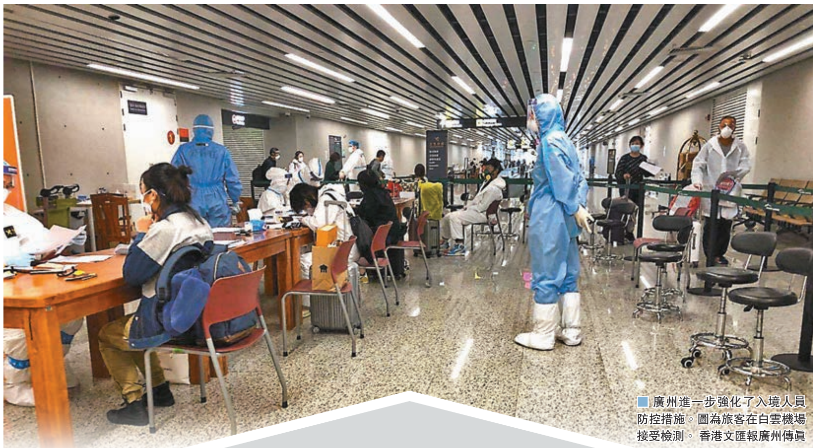
廣州進一步強化了入境人員防控措施。圖為旅客在白雲機場接受檢測。

香港文匯報記者電話聯繫首都機場和天津濱海國際機場獲悉,「第一入境點」其實是國際航班在抵京前增加的一道防疫檢疫程序,乘客要先在這裡接受檢疫。如果有發熱等症狀,乘客會被送往就近的發熱門診進行進一步隔