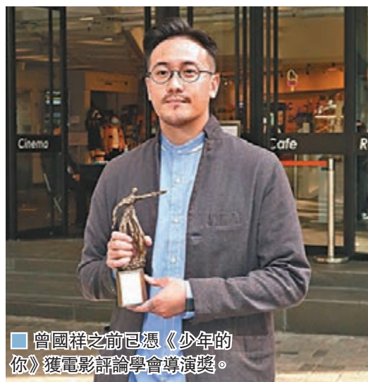
曾國祥之前已憑《少年的你》獲電影評論學會導演獎。

香港文匯報訊(記者 梁靜儀)「香港電影導演會年度頒獎典禮」每年均舉辦年度頒獎典禮，以導演專業角度對傑出同業予以肯定和鼓勵，昨日大會公佈得獎名單，但鑑於新冠肺炎疫情，今屆頒獎禮未能如期舉行，頒獎形式將另作安排。《少年的你》成為大贏家，分別奪得「最佳電影」、「最佳導演」(曾國祥)及「最佳女主角」獎(周冬雨)，今次結果被視為香港金像獎前哨，因而劇組再獲看高一線。