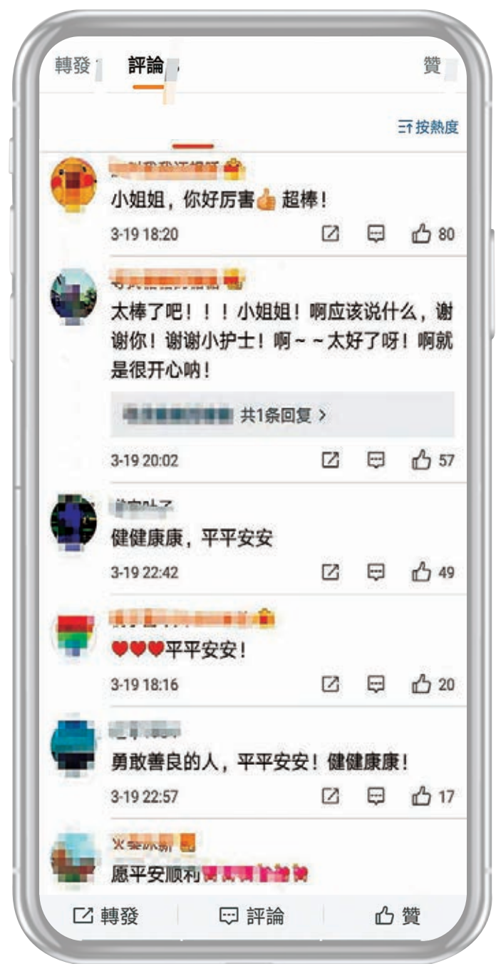
致敬祝福寫滿了接種義工的微博評論。