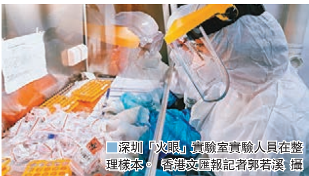
深圳「火眼」實驗室實驗人員在整理樣本。

西亞爾托表示，感謝中方及時提供醫療物資援助，並向匈方在華採購予以便利；登迪亞斯說，感謝中方在此前所未有的艱難時刻提供急需醫療物資援助；布里達亦表示，中國為國際社會抗擊疫情樹立了標杆，摩洛哥迫切希望向中方學習借鑒疫情防控經驗，期待同中方醫療專家加強交流與合作。