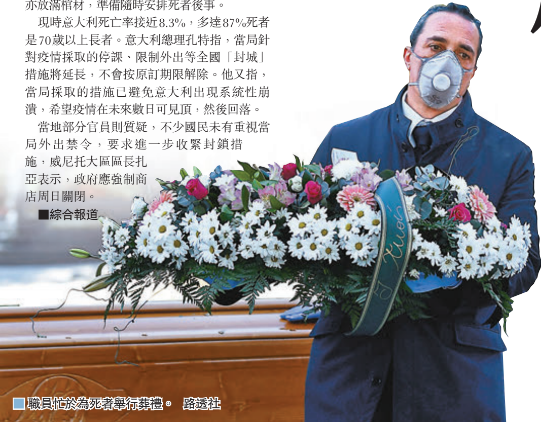
■ 職員忙於為死者舉行葬禮。