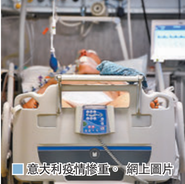
■ 意大利疫情慘重。