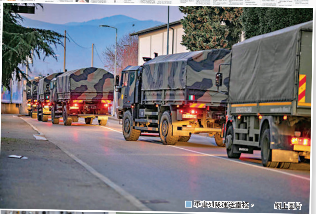
■ 軍車列隊運送靈柩。