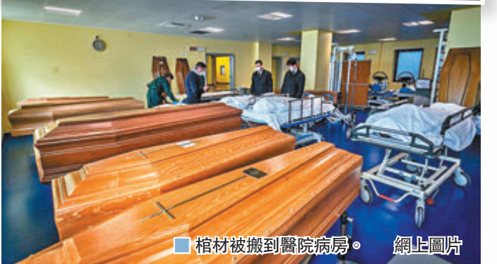
■ 棺材被搬到醫院病房。網上圖片