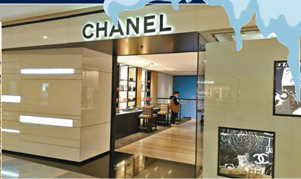
奢侈品店人流疏落。