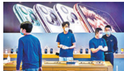
蘋果內地、香港及美國等官網已限制消費者每個 iPhone 型號最多只可買2部。圖為蘋果北京門店。資料圖片

香港文匯報訊(記者 馬翠媚) 新冠肺炎疫情全球肆虐，除了零售業大受影響，生產供應鏈亦無一倖免。剛推新