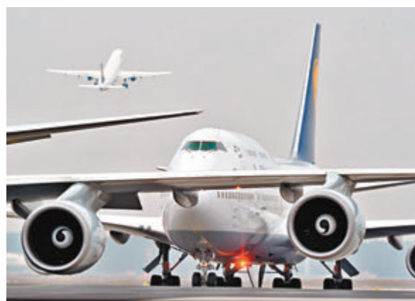
航空、郵輪和石油公司等受創最嚴重的行業，將是第一波大規模降級目標。

美元，全球企業將損失12萬億美元。他認為美國政府需要推出更多措施支撐經濟，視乎貸款擔保和信貸等金融救助形式，料要推出規模最少有1.5萬億美元至2萬億美元的財政刺激措施救市，否則當地很多人將面臨破產。