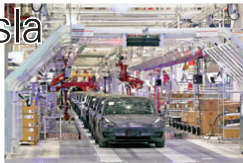
Tesla上海工廠將正常運營。資料圖片

香港文匯報訊(記者 殷考玲) 新冠肺炎疫情持續蔓延，國際企業陸續宣佈暫停生產，電動車公司特斯拉(Tesla)昨公佈下周二(24日)正式關閉加州弗里蒙特工廠及紐約超級工廠，至於內華達州電池工廠則繼續運營。特斯拉指，在內地的數百家供應商和整個上海工廠則正常運營，並提高內地廠房產量。