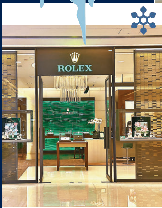
龍頭鐘錶品牌勞力士多個製錶廠已停工。受疫情影響，其在香港IFC的鐘錶店亦門可羅雀。香港文匯報記者攝