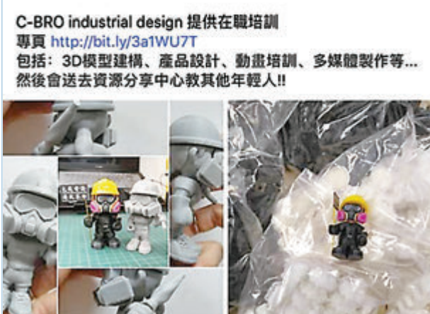
陳聲指「手足」做手作時薪只有60元。