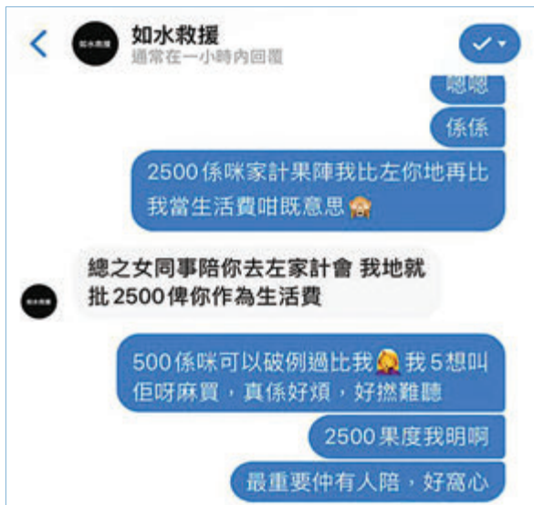
「如水救援」講明會批出$2,500男女「手足」做生活費。網上圖片