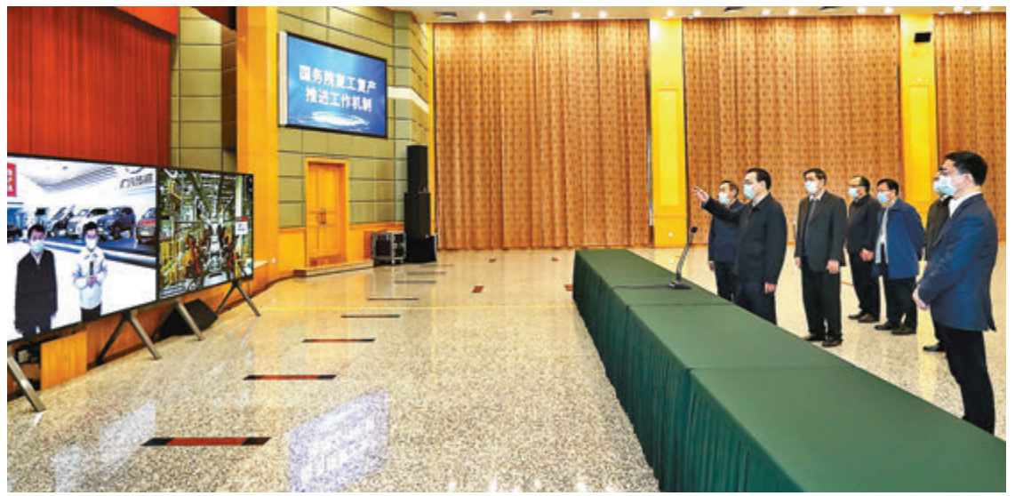
3月20日，李克強考察疫情防控與生活物資保障服務、復工復產推進工作、宏觀政策協調實施等情況。

李克強聽取全國復工復產匯報，與陪同考察人員研究解決復工復產中的困難。他說，各級黨委和政府既要繼續抓好防控、防止疫情反彈，又要做好促發展、穩就業工作。從近段實踐看，防控措施到位，並保持必要的健康監測和應急處置力量，復工復產可以同步推進。要根據疫情變化，安全有序取消臨時管制措施，消除不合理障礙，推動放管服改革，為企業特別是中小微企業和個體工商戶多服務多解難，把市場主