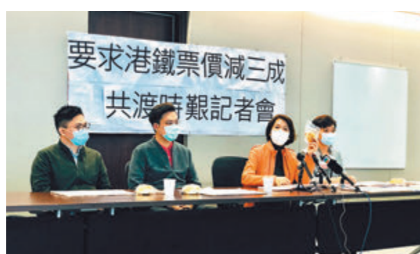
■經民聯促請港鐵立即減票價三成至今年底，與民共度時艱。

經民聯多名成員在記者會尾聲拿起香港特產「菠蘿包」，呼籲港鐵盡快履行企業社會責任，減價三成，讓市民每天都「慳返3蚊」，等於賺到個「菠蘿包」。他們今日還會落區派發「菠蘿包」作宣傳。