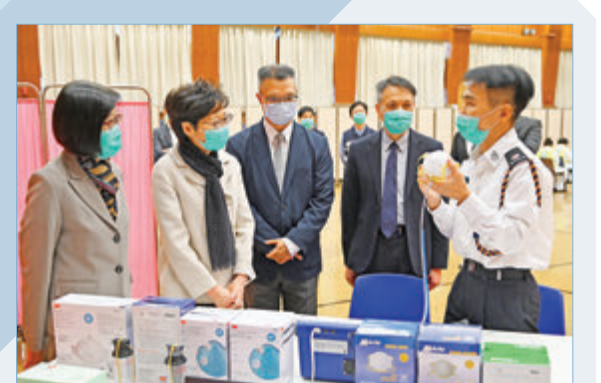
行政長官林鄭月娥昨日到醫療輔助隊總部，了解醫療輔助隊在抗疫期間的工作，並與前線醫療輔助隊人員見面，感謝他們一直在抗疫的前線。由於疫情預計會維持一段時間，她希望醫療輔助隊人員繼續迎難而上，同心守護市民的健康，並強調政府會優先為他們提供口罩等防護裝備。

同時，申請文件需要網上登記，但有一部分商戶對電腦操作不太熟悉，特區政府應在這方面提供協助。