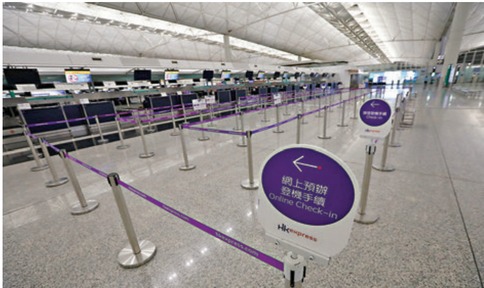
■香港快運宣佈由下週一起暫停營運至4月底，機場的登機櫃位昨日人去樓空。