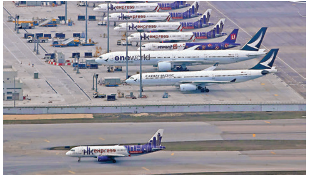
■受新冠肺炎疫情影響，訪港旅客幾乎「歸零」，不少航班需要取消，香港快運由下週一起暫停營運。圖為多架香港快運的客機只能在停機坪停泊。

國泰航空昨日表示，調整客運網絡運力後，國泰航空將營運各每周三班航班往返香港及12個目的地，包括倫敦(希思羅)、洛杉磯、溫哥華、東京(成田)、台北、新德里、曼谷、雅加達、馬尼拉、胡志明市、新加坡及悉尼。