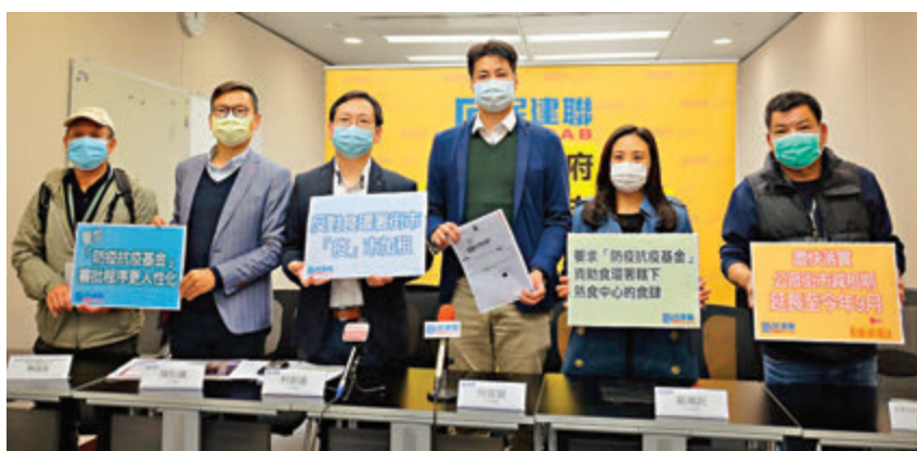
■多名民建聯議員昨日聯同業界代表舉行記者會，要求政府在現有「防疫抗疫基金」基礎上，增加對食環署轄下街市商戶資助。

為此，民建聯建議政府盡快落實延長減租一半至今年9月。對經營情況最艱難的熟食中心，民建聯要求食環署豁免4月至9月的租金，並在減租期間減免商戶冷氣費。