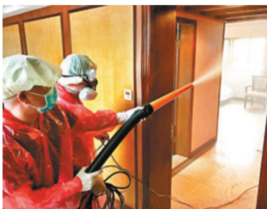
工作人員對隔離房間進行消毒。

香港文匯報訊(記者 教敏輝 廣州報道)隨着國外疫情持續發展,加上清明之際迎來返鄉探親、祭祖高峰,「中國第一僑鄉」江門入境回國人員上升。作為當地接受入境隔離的主要酒店之一,港資台山園林酒店隔離人員持續增加,酒店已入住隔離人員106人,最快20日便會滿員。