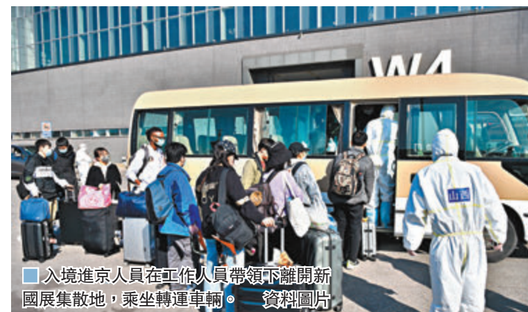
入境進京人員在工作人員帶領下離開新國展集散地,乘坐轉運車輛。資料圖片