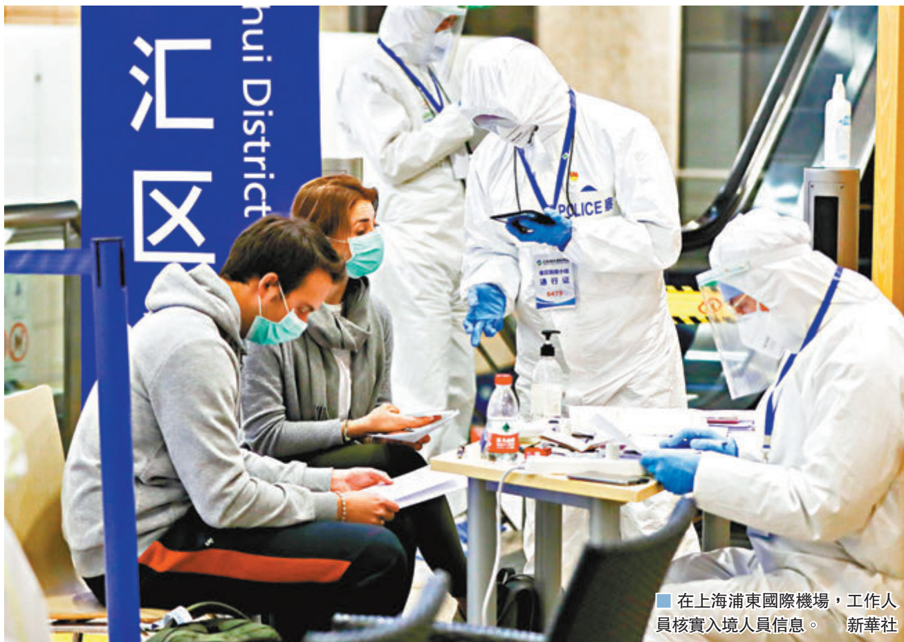
在上海浦東國際機場,工作人員核實入境人員信息。

他表示,目前歐洲和北美洲國家的新冠肺炎發病率非常高,北京、廣東、上海等省市入境防疫壓力都非常大,應該按着北京的無差別標準來實施隔離政策。