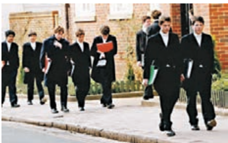
英國教育部門宣佈，英國大中小學從今日起關閉，直到另行通知為止。圖為英國伊頓公學學生穿梭於課間。

前幾日，英國政府宣佈，輕症患者不必進行檢測和就醫，寄宿家庭又時刻面臨隔離風險，下一秒鐘孩子將何去何從，令遠在大洋彼岸的千萬個家長急得像熱鍋上的螞蟥。 一名13歲留英孩子的媽媽在給中國駐英國大使館的一封信中提到，英國是中國低齡留學人數最多的國家，此次疫情爆發後，機票難買，很多小留學生隔着手機屏幕大哭，家長熬着時差陪孩子流淚，懇請組織包機將未成年留學生送回國，並願意支付相關費用，也願意服從中國政府的防疫措施做好隔離。