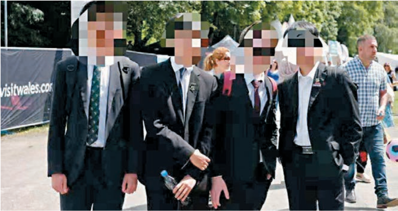
在英國威爾士留學的低齡中國留學生（13歲）。