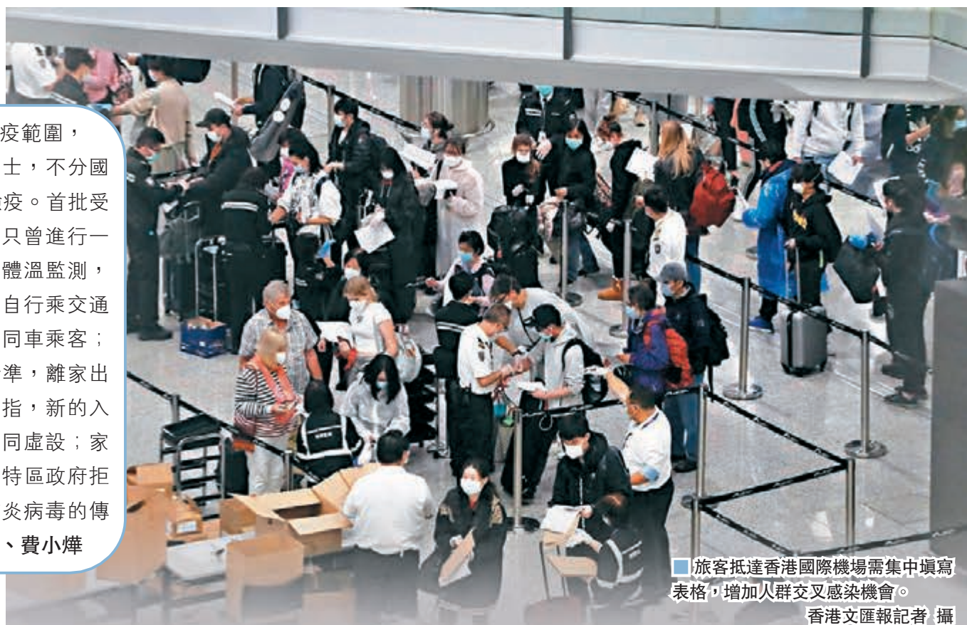
旅客抵達香港國際機場需集中填寫表格，增加人群交叉感染機會。

由昨日開始，所有從澳門及台灣以外地區入境香港者，均需接受14天強制檢疫，香港文匯報記者昨日到機場了解他們抵港後的檢疫情況。綜合多位旅客所述，他們在航機上預先獲發健康申報表及檢疫令表格，需填寫姓名、身份證號碼、聯絡電話、地址、航班編號與座號及有否發燒與咳嗽等症狀。