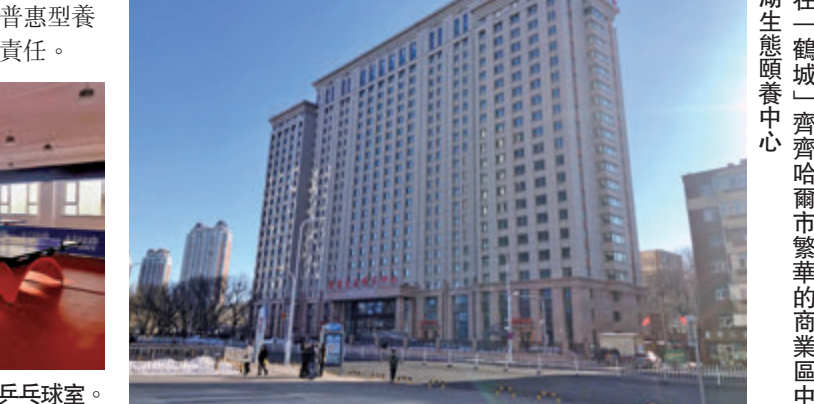
坐落「鶴城」齊齊哈爾市繁華的商業區中心