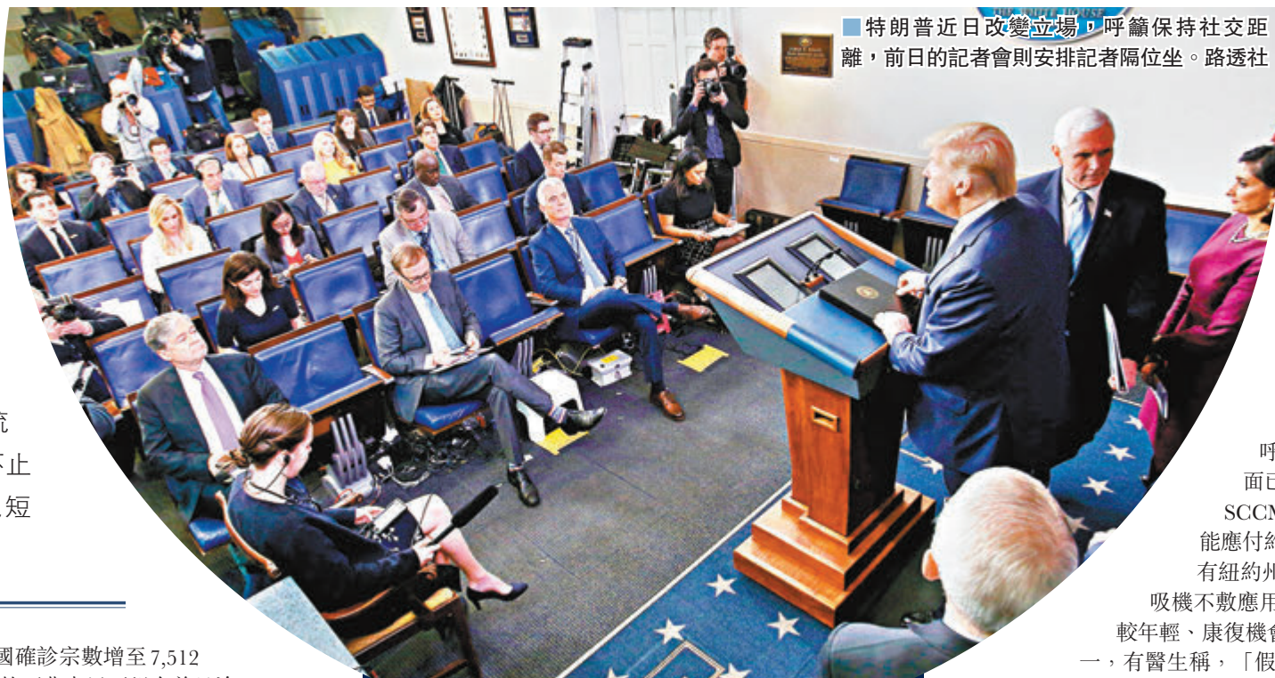
■ 特朗普近日改變立場，呼籲保持社交距離，前日的記者會則安排記者隔位坐。路透社