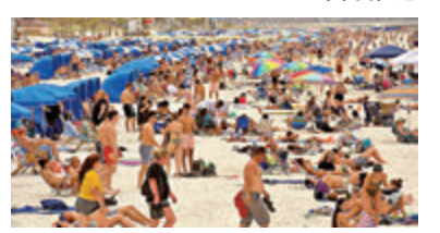
加州前日仍有大批民眾到海灘。

加州三藩市灣區率先在前日下令「原地避難」，要求除了進行必要活動以外，民眾需盡量留在家中，亦不准並非共住的居民聚會，若需要外出如前往公園等，人與人之間需保持6呎距離。