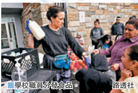
學校職員分發食品。

衛生部國家過敏與傳染病研究院(NIAID)主任福奇則向記者指出，可合理推測，美國疫情會在45日達到高峰，防疫小組會研究是否需要在未來兩週推出更嚴格措施，並呼籲年輕人留在家中。