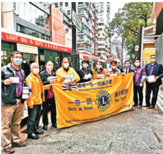
香港一帶一路獅子會及公共小型巴士總商會首長和義工到旺角專線小巴站向司機派口罩。

本文所載資料並不構成受監管之業績公告。內容以上載於長江基建網站 www.cki.com.hk 及香港交易及結算所有限公司網站 www.hkexnews.hk 之業績公告全文為準。