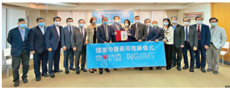
食衛局將國家中醫藥管理局贈送的中成藥交由香港中醫藥界抗疫聯盟派發市民。

據介紹，今次贈送的「連花清瘟膠囊」及「藿香正氣片」在港均有註冊。不過，聯盟亦提醒市民，若家居隔離者本身沒有病徵則不宜服用；若出現病徵則可服用以紓緩不適，並聯絡衛生署作進一步檢查。而孕婦不宜服用，