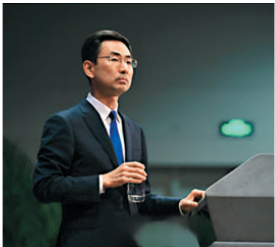
▲耿爽強調，中方採取的措施屬於中央政府依據「一國兩制」和基本法享有的外交事權。

在昨日的外交部例行記者會上，大多數問題都圍繞中方的反制措施。被問到美國國務卿蓬佩奧聲稱美方只是禁止「外國使團」，與中方點名的媒體「不對等」，耿爽指出，中國堅持走中國特色社會主義道路，在新聞輿論方面也堅持走符合自身實際的道路。中國媒體始終在憲法和法律允許的範圍內開展新聞報道工作。中國媒體在美機構一向遵守美國法律，恪守新聞職業道德，在美正當地開展新聞報道工作。