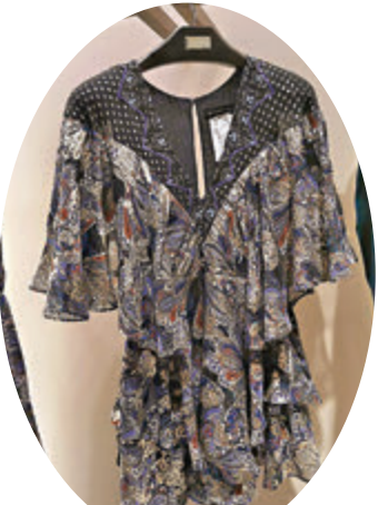
今年春夏系列的印花圖案

意大利品牌 ETRO 於去年在米蘭發佈了全新 2020 春夏女裝系列，品牌從墨西哥穆赫雷斯島和摩洛哥丹吉爾，到地中海伊比薩島和印度果阿島這些上世紀 70 年代嬉皮士們喜愛的地方收集靈感，感受當地的風情。這裡有伊卡特綵線段和美麗的佩斯里圖案，以及柏柏爾條紋和神秘的部落飾物。然而，最令人無法忘記的是這座城市及文化帶來的精緻手工服裝和迷人的學院風格，他們的衣飾不拘一格且豐富多彩。整個系列巧妙地運用對比的效果，迷人而有趣。加上，質地輕盈且色彩斑斕的刺繡面料，點綴着饒富金屬感的流蘇和鮮豔的印花圖案，結合優質的針織面料，令手工棉質斗篷外套和超長開襟羊毛衫更精緻。另外，蝴蝶是自由和重生的象徵，蝴蝶圖案成為了品牌印花的主角，美麗的蝴蝶圖案融入了佩斯里圖案之中，巧妙地被應用在精緻的禮服上。