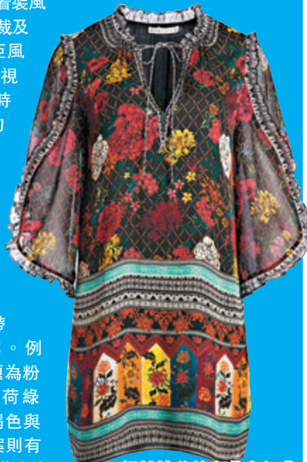
設計精美的印花與經典品牌的花卉圖案演繹

美國品牌 Alice + Olivia 的 2020 春季系列受現代女性着裝風格所啟發，在現代剪裁及配搭中注入波希米亞風情。今季呈現全新視角，着重於純色和時尚撞色搭配，新品的設計旨在與同季及下季純色單品打造出完美混搭或成套裝扮。其設計精美的印花與經典品牌的花卉圖案演繹春天，而且每一月更帶來不同色調與圖案。例如，二月的色調主題為粉橘色、金褐色、薄荷綠色、橄欖綠色、棕褐色與奶油色；而印花圖案則有復古花樣、初綻的花蕾與春雨等。