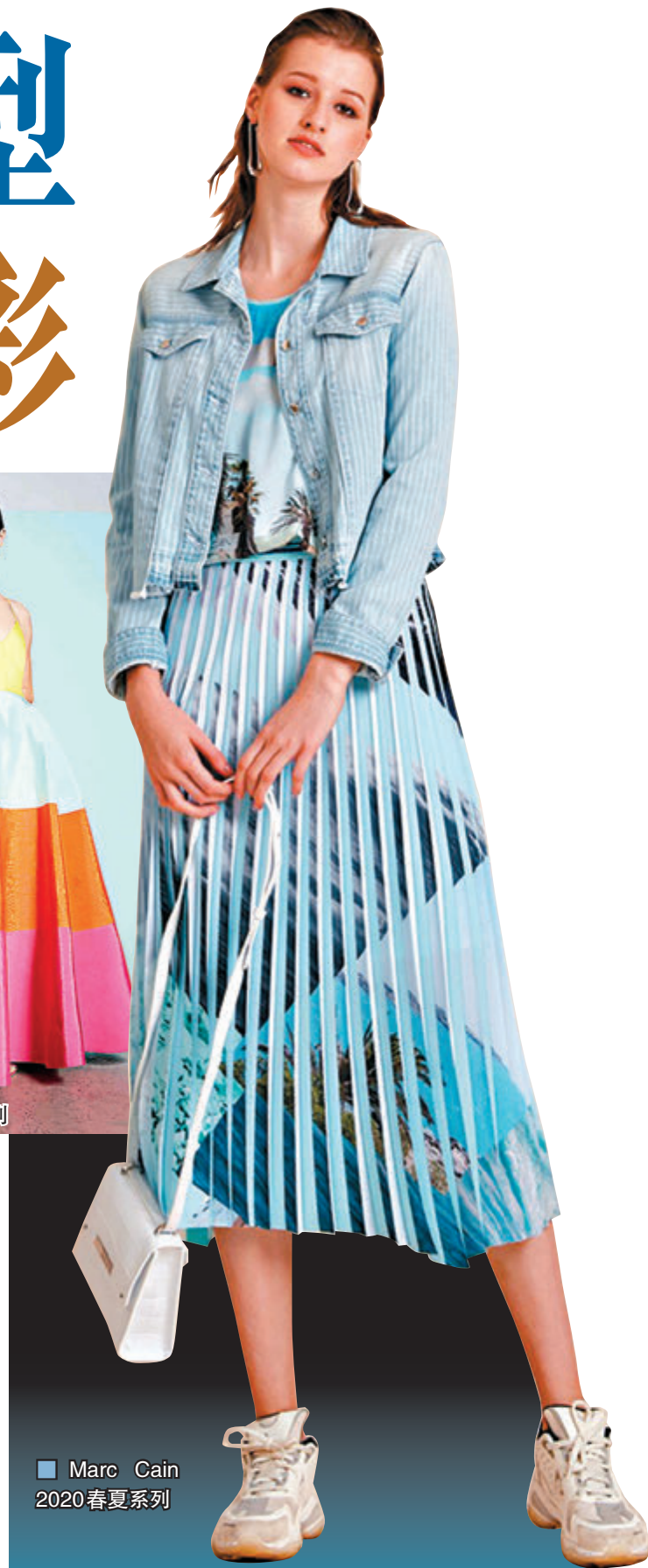
Marc Cain 2020 春夏系列