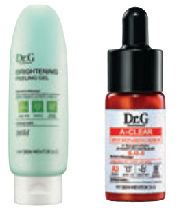
保濕淨肌 速效暗瘡 角質更新凝膠 修復精華膠

疫情持續不斷，最近每日都過着「罩不離口」的日子，對於愛美的女生來說，護膚無疑變成一大挑戰，長時間戴上口罩時，肌膚溫度上升刺激油脂分泌，而呼出空氣又帶有水分，提高口罩內的濕度，濕熱環境更易令細菌滋生，油脂及污垢堆積在毛孔內，燭出滿臉面油、暗粒及暗瘡。