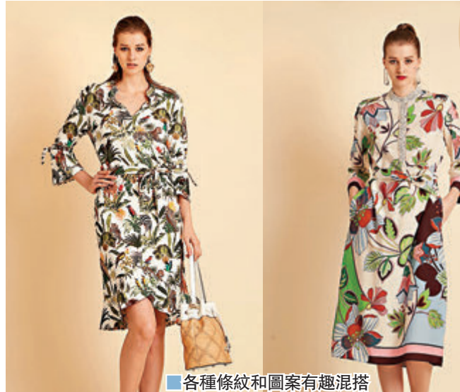
各種條紋和圖案有趣混搭

德國高端女裝品牌 Marc Cain 一直秉持將美學、藝術和實用主義結合，全新 2020 春夏系列表達愛的宣言，展現活在當下，豁達自信的當代女性形象。今季着重繽紛色彩與創新面料的結合，設計同時加入層次靈感，各種格仔間條、花卉印花、幾何圖案，以及經典動物形態組成今季產品全新的時代精神，展現優雅女人兼具質幹與品味的獨特魅力。系列採用南非獨特的柔粉白哲色孤挺花，在雨季以自然姿態展露出其獨特的色彩魅力。花瓣上的雨滴在陽光照耀下閃爍出明媚的光彩，這美妙的景色巧妙激發「花雨襲人」系列的色彩靈感。碎花圖案與清晰的斜條紋相得益彰，豐富單色外觀，優雅地融合精緻高品質針織面料，營造亮點效果及女性化造型的雅致氣質。同時，舞動的暖色調由自然的大地色及各種天然中性色微妙組成，配以高飽和的珊瑚色和紅橙色，處處散發出女性化氣息。搶眼的亮紅色調和炫黑色勾畫出必要的輪廓，野生斑馬和威風凜凜的貓科猛獸以其不凡的形態，與各種格仔、條紋和圖案的有趣混搭，演繹耳目一新的外觀。