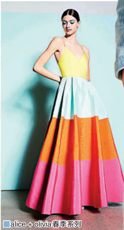
Alice + Olivia 春季系列