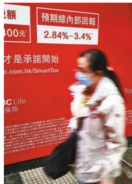
數字顯示去年下半年內地客新造保單保費急挫。