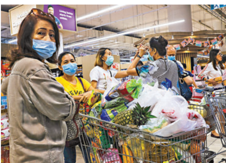
新加坡市民在超市搶購食物等生活用品。

新加坡大批居民得悉大馬鎖國後，紛紛到超市搶購必需品，有顧客憂慮大馬長期關閉邊界，「我們必須多買點。」當地連鎖超市FairPrice宣佈限購措施，每名消費者最多只可購買4條廁紙、兩份粉麵、兩包米、30隻雞蛋、肉類和蔬