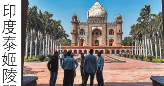
印度泰姬陵因疫情暫時關閉。

印度近期每日都出現新增新冠肺炎確診病例，累計已達125宗，孟買昨日更出現首宗死亡個案。當局昨日起關閉泰姬陵及其他古蹟與博物館至31日。