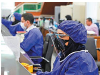
德黑蘭銀行職員全副武裝。

伊朗昨日新增1,178宗確診，累計宗數達16,169宗，其中988人死亡，國營電視台昨日發出疫情爆發以來最嚴厲警告，稱如果民眾不聽衛生官員指引，繼續外出的話，全國可能會有數百萬人死於疫情。