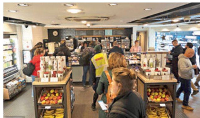
英國不少商店依舊營業，店內亦有多名顧客。

英美兩地新冠肺炎疫情持續蔓延，曾經多次淡化疫情的美國總統特朗普，以及因為「佛系抗疫」飽受批評的英國首相約翰遜，前日齊齊180度大轉軸，公開要求民眾暫停社交活動，避免聚會及外遊。特朗普承認未能控制病毒散播，預料疫情或者持續至7至8月，同時警告美國經濟有機會陷入衰退。