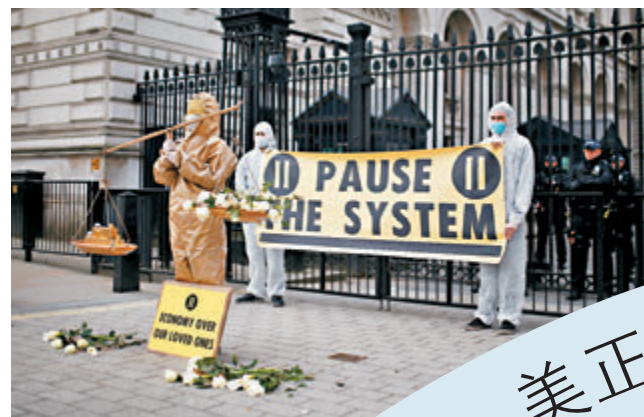
示威者促請英政府應對危機。

截至昨日，美國共錄得4,740宗新冠肺炎確診病例，85人死亡；英國確診則升至1,950宗，55人死亡。疫情嚴重迫使兩國領導人面對現實，放棄此前淡化疫情或放任防疫的主張，改為跟隨其他國家採取保持社交距離的政策。