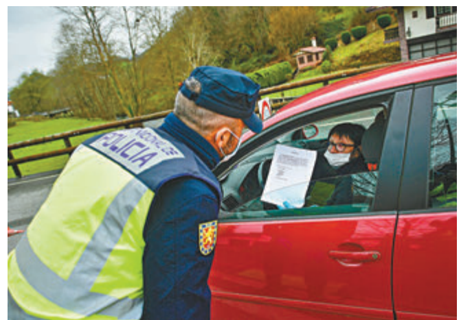
歐洲多國嚴格限制民眾外出。美聯社

默克爾同日亦宣佈多項新防疫措施，下令宗教場所停止聚會，非出售必需品的商店停業，博物館、泳池和健身房等公眾場所亦關閉，食肆和咖啡店則只可營業至下午6時。默克爾形容措施前所未見，呼籲國民配合，並取消本地或海外旅遊行程，期望德國能盡快走出疫情。 ■美聯社/路透社/法新社