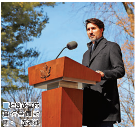
杜魯多宣佈實行全面封關。

日本傳媒亦引述政府消息人士報道，當局考慮要求從歐洲入境旅客，包括日本公民，自我檢疫14日，最快在今日有決定。 ■綜合報道