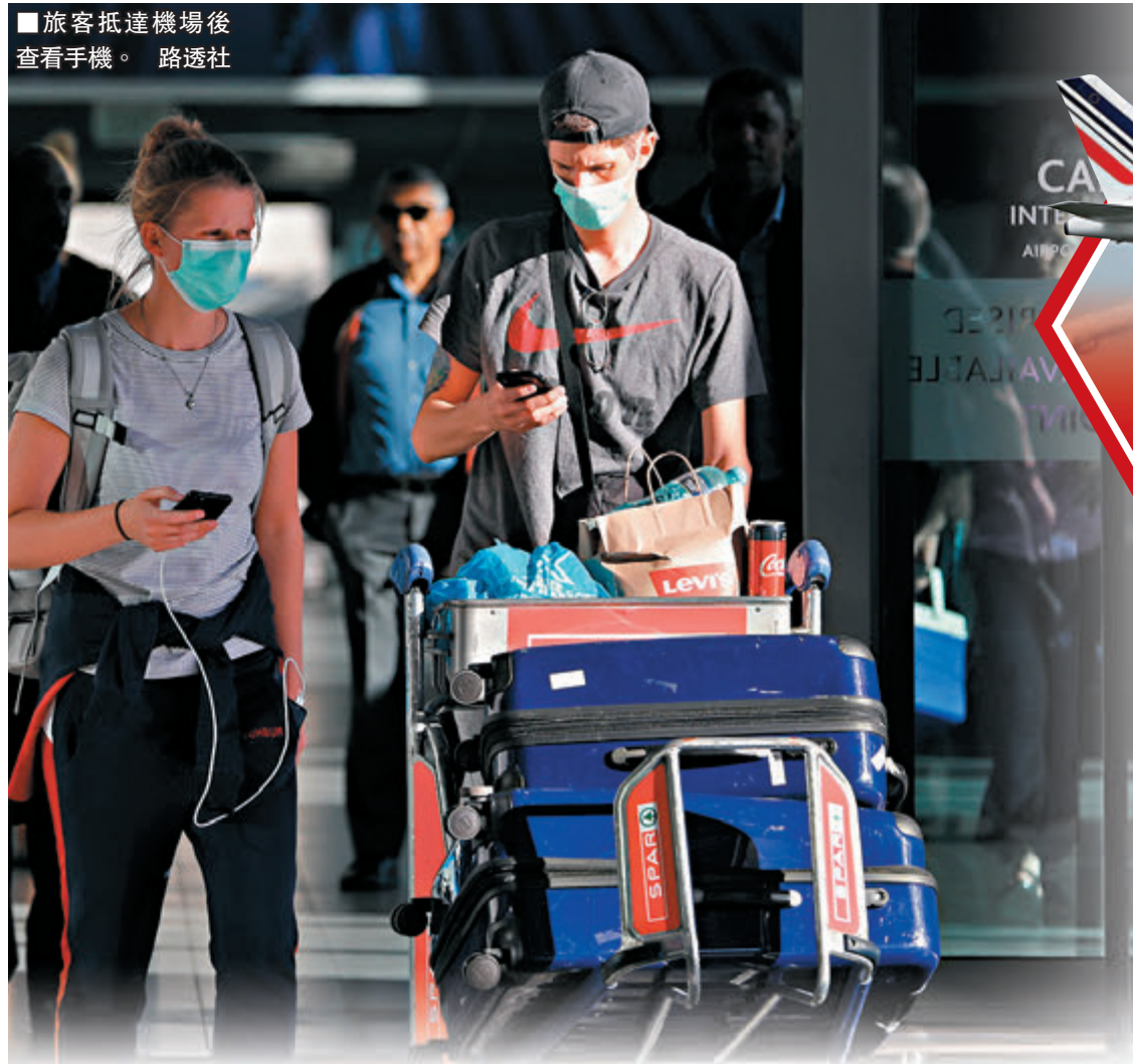
旅客抵達機場後查看手機。