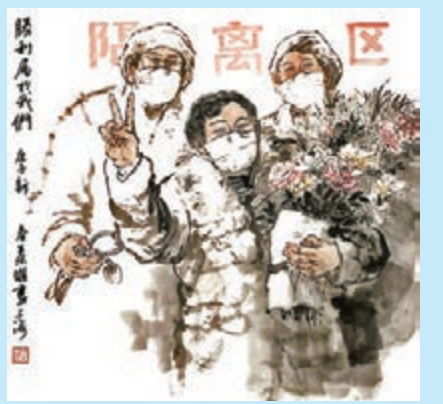
葉雄，中國畫《勝利屬於我們》