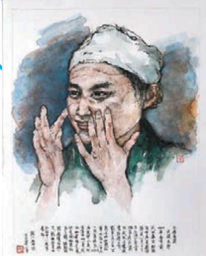
洪紐一，鋼筆水彩《大疫當前，天使先行》