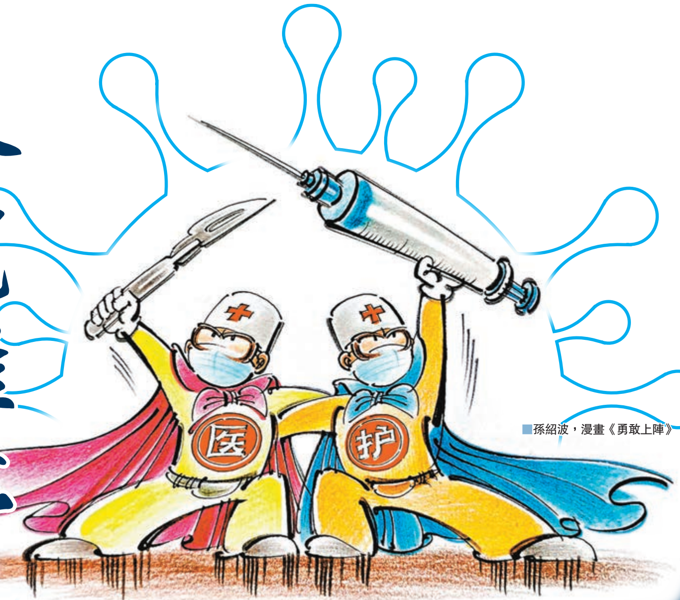
孫紹波，漫畫《勇敢上陣》