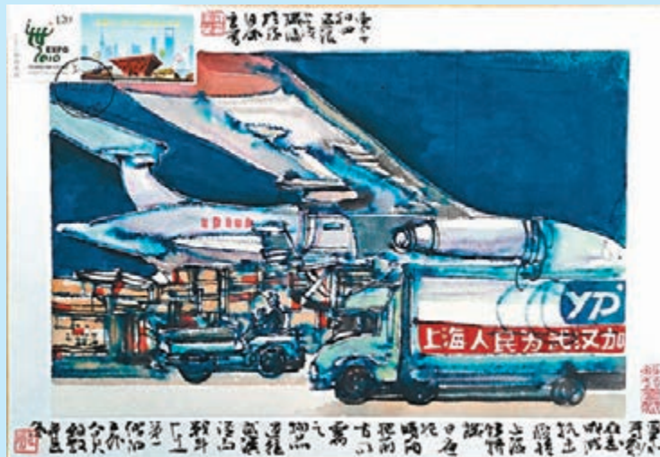
汪家芳，中國畫《爭分奪秒》