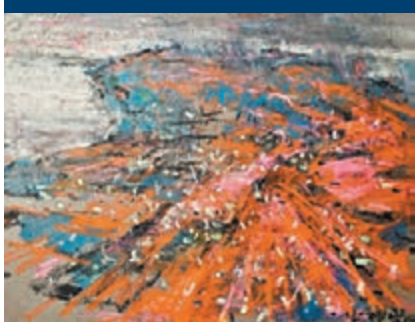
李向陽，油畫《決戰火神山》