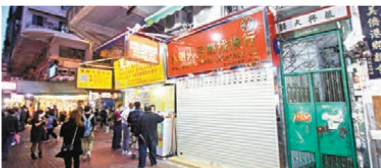
涉案找換店開業逾十載，估計涉數十人中招，合共近700萬元款項。

昨晨11時許，李太太在區議員陪同下到上址找換店跟進匯款問題時，發現同時有其他人亦追討匯款事宜。直至下午1時許，找換店已聚集數十人，其間有人要求退