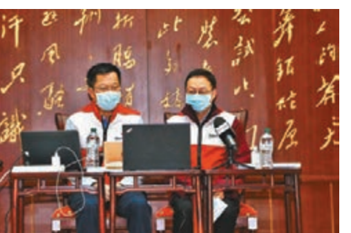
專家組為旅意僑胞、留學生進行了視頻輔導直播，介紹了新冠肺炎的症狀特點、預防常識、治療手段等。新華社

和意大利科研機構、衛生部門等加強交流，了解意大利整個疫情防控情況，推動更加深入的合作。接下來，專家組會前往意大利北部疫情嚴重地區進一步了解情況。