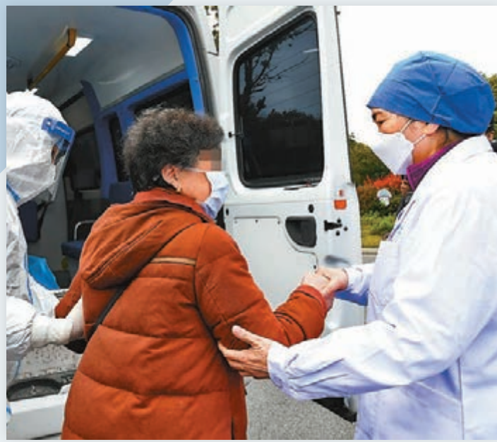
昨日，湖北省武漢市武漢大學人民醫院東院區收治的一位重症患者治癒出院，中國工程院院士、國家衛健委高級別專家組成員李蘭娟為該患者送行。這是該院的第600位出院治癒患者。圖為李蘭娟院士（右）送治癒患者上車。