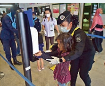
大馬警官幫助小童使用消毒液。

地所有清真寺亦會關閉10日。大馬昨日新增125宗確診,95宗與大城檳城清真寺相關,全國累計病例達553宗。衛生部長阿漢峇峇指出,确诊病例自上周起有明顯增加趨勢,大馬已進入「後期遏止」階段,防疫工作以阻止疫情擴散及惡化為目標。 ■綜合報道