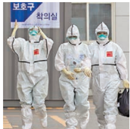
韓國大邱醫護在治療間隙休息。

韓國昨日新增74宗確診個案,較前日少兩宗,是連續兩日新增病例不足100宗,累積個案升至8,236宗。韓國總理丁世均認為,情況反映韓國疫情緊急形勢已過,開始出現「希望的信號」,他強調當局需制訂後續措施,防止海外輸入個案發生。日本據報亦計劃擴大對歐洲國家的