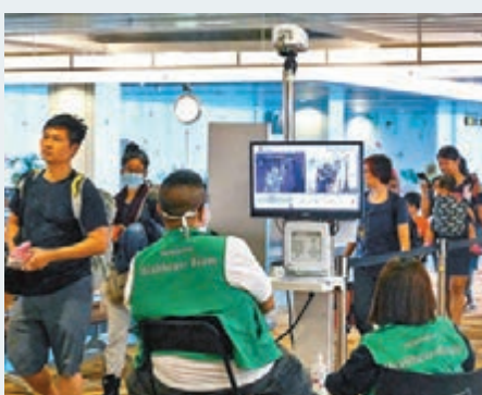
新加坡樟宜機場檢測遊客體溫。

慕尤丁表示,由明日起至本月31日,在全國實施公眾行動管制,不可舉行任何集會或活動,涵蓋宗教、體育、社會、文化等範疇;大馬公民不可外遊,公民回國需要隔離檢疫14天,同時所有外國遊客禁止入境。除提供必需服務的機構外,所有政府機構會關閉,所有教育機構亦需停課,商戶亦只有日常用品商店可營業。當